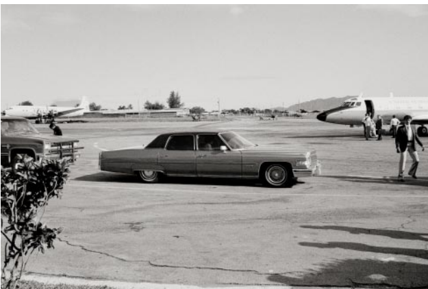
05 An armored Cadillac belonging to the U.S. Embassy awaits an arriving U.S. government plane. Ilopango Airport, San Salvador, 1982