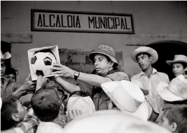
07_Lieutenant Colonel Domingo Monterrosa, Atlacatl Battalion commander, hands a new soccer ball to local children as part of a civil pacification operation near guerrilla territory. Joateca, Department of Morazán, October 1984