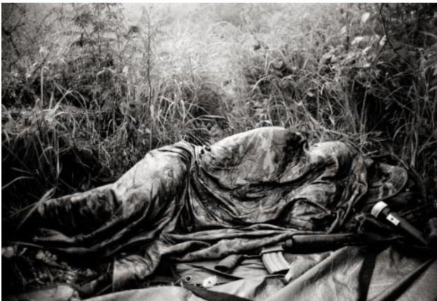
09_An Atlacatl Battalion soldier sleeps before his unit moves at dawn into position against ERP guerrillas during a counterinsurgency operation. Department of San Miguel, September 1983