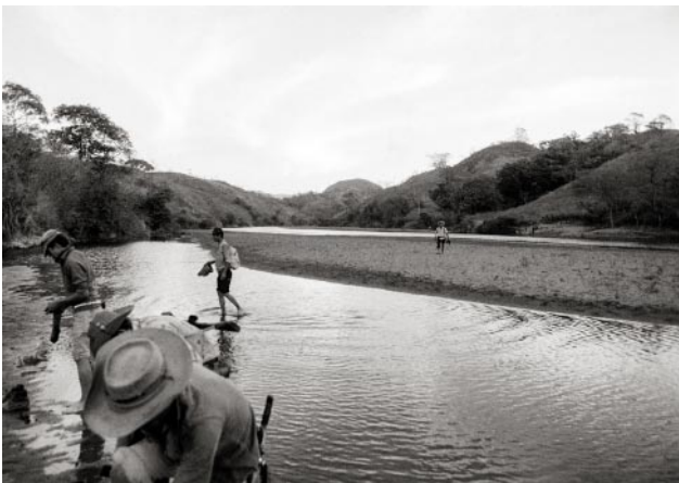
11_In FPL territory, guerrillas cross a river near the Salvadoran-Honduran border. Department of Chalatenango, February 1981