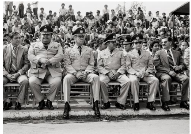
10_Salvadoran military commanders attend a ceremony at the Escuela Militar Capitán General Gerardo Barrios. Santa Tecla, May 1983