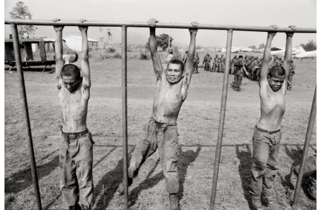
08_Salvadoran Army recruits take part in a training exercise overseen by U.S. Army Rangers and Special Forces at a Salvadoran Air Force base. Ilopango Airport, San Salvador, March 1983