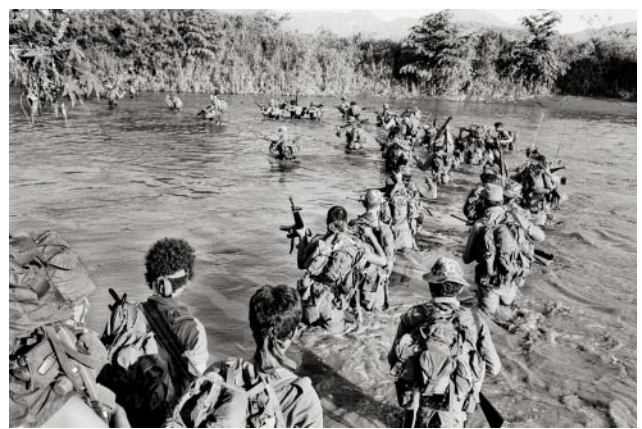
04 Members of the Atlacatl Battalion cross a river during a counterinsurgency operation. Department of San Miguel, September 1983