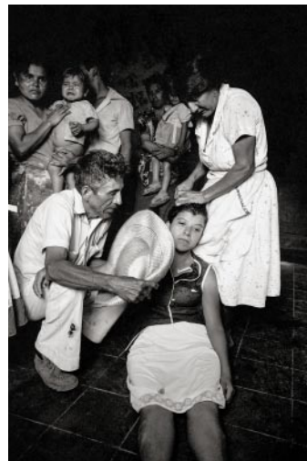
06 The sister of one of the victims faints upon hearing of his death. Santa Clara, July 1982