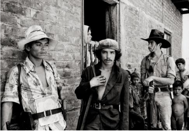
01 ERP guerrillas pause to talk to local residents. San Agustín, Department of Usulután, July 1983