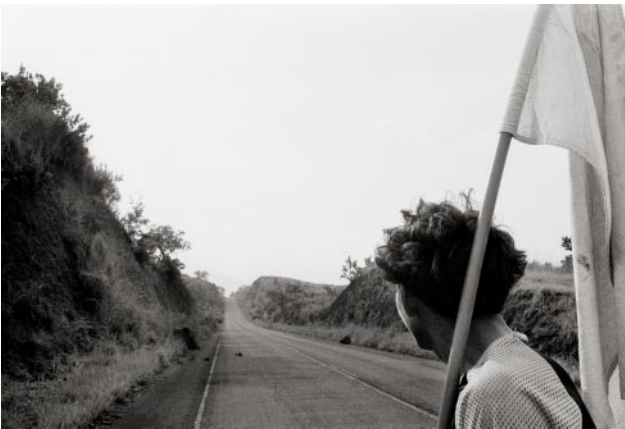
03 A Salvadoran journalist displays a white flag to show FPL guerrillas that he travels in peace on the Pan American Highway. Department of San Vicente, June 1983