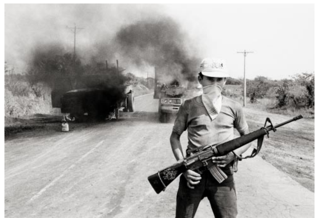
12_An ERP guerrilla stands in front of burning trucks on the Pan American Highway. Department of Usulután, March 1983