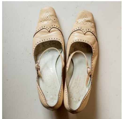
12 ©Tina Ruisinger