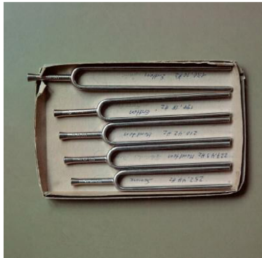
4 ©Tina Ruisinger