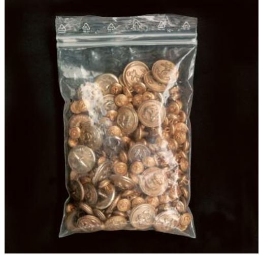
8 ©Tina Ruisinger