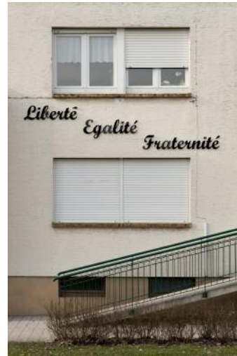
2_Ritzing, FRA, 2015