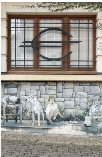
5_Mondorf-les-Bains, LUX, 2015