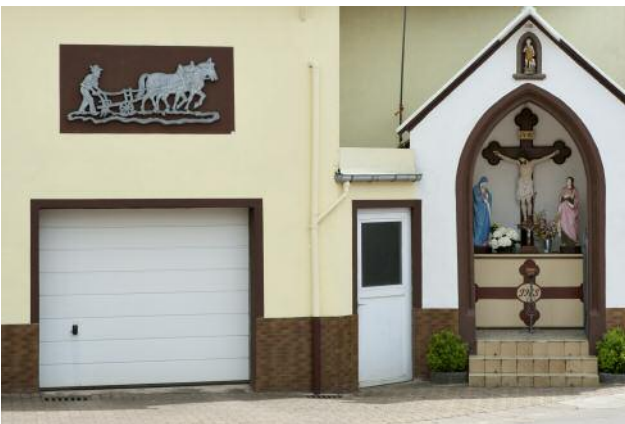
9_Perl-Borg, DEU, 2015