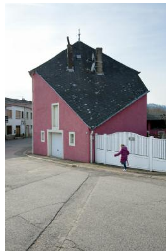
6_Montenach, FRA, 2015