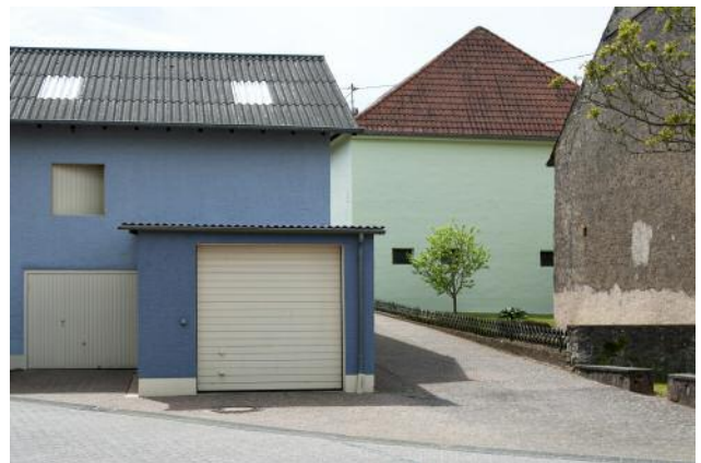
10_Perl-Borg, DEU, 2015