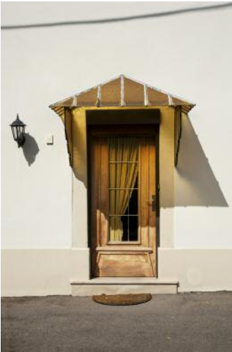
1_Apach, FRA, 2014