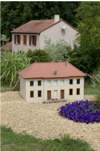
3_Manderen, FRA, 2015