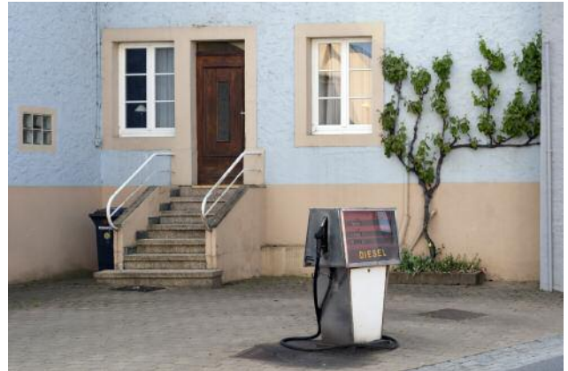
8_Schengen-Remerschen, LUX, 2015