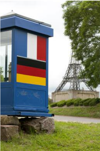
7_Apach, FRA, 2015