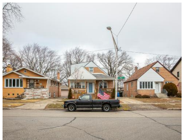
04_February | Mount Greenwood