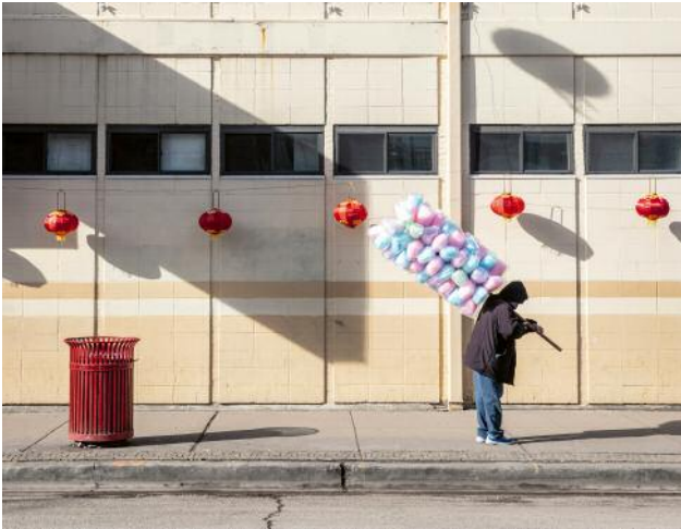
01_Amour Square | February