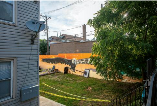
07_Lower West Side | July