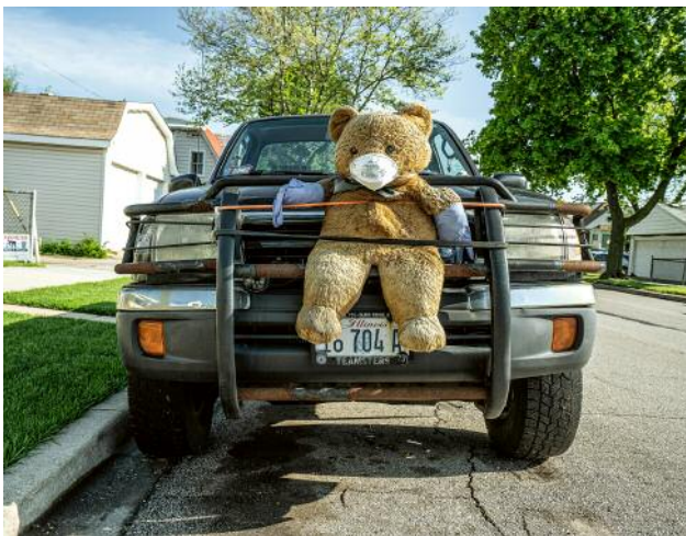
03_Portage Park | May