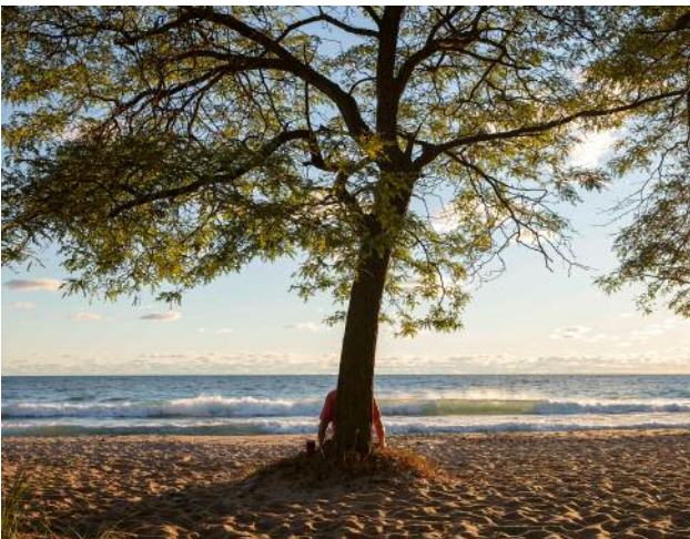
09_Rogers Park | September © Ryan Bakerink