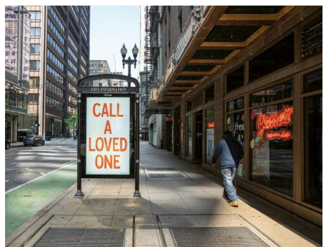
6_The Loop | April