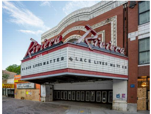
02_Uptown | June