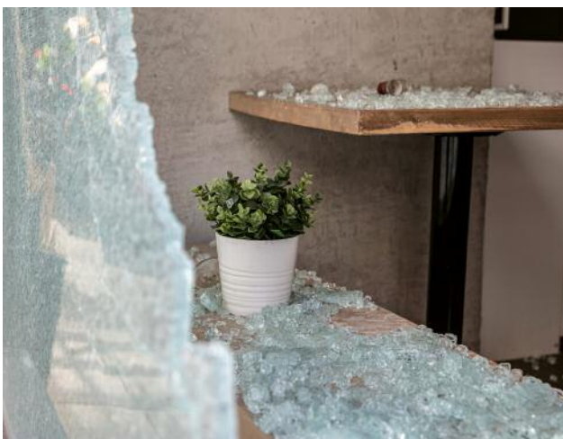
05_The Loop | May