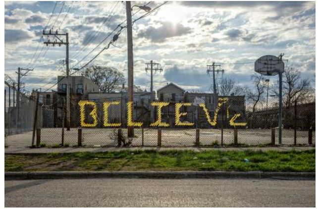
08_North Lawndale | April