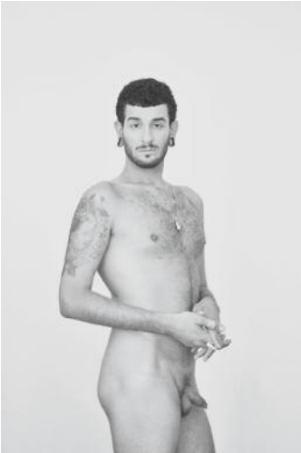
7_Leonardo © Ashkan Sahihi