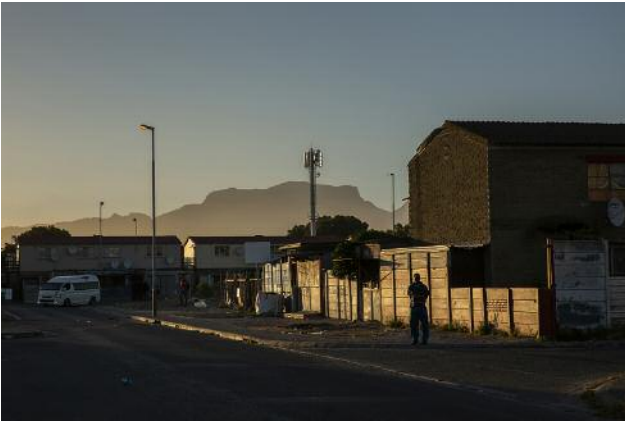
01_Table Mountain from Sabie Road, 2020