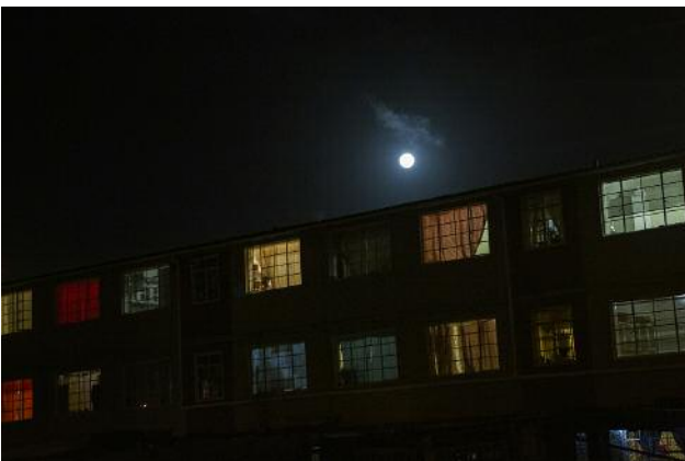
05_A full moon rising over Manenberg, 2018