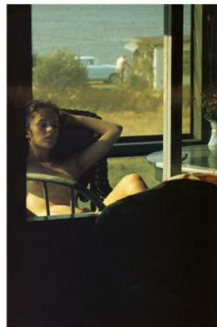
18_Saul Leiter, Lanesville, 1958