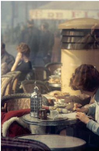
09_Saul Leiter, Paris, 1959 © 2023 Saul Leiter Foundation