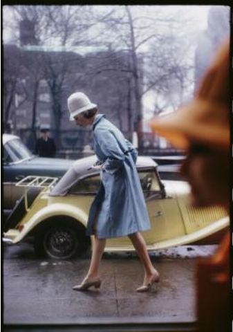
13_Saul Leiter, Harper's Bazaar, April 1962 (unveröffentlicht) © 2023 Saul Leiter Foundation