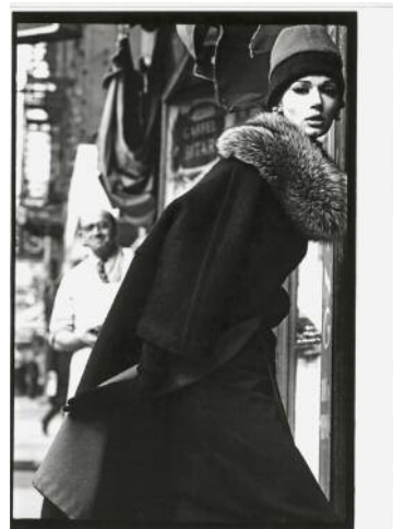
12_Saul Leiter, Harper's Bazaar, Juli 1959 (unveröffentlicht)