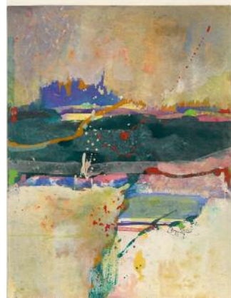
14_Saul Leiter, Ohne Titel, undatiert. Gouache und Wasserfarbe auf Papier, 30,5 x 22,9 cm © 2023 Saul Leiter Foundation