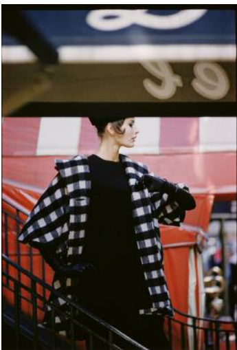
11_Saul Leiter, Harper's Bazaar, September 1961 (unveröffentlicht) © 2023 Saul Leiter Foundation