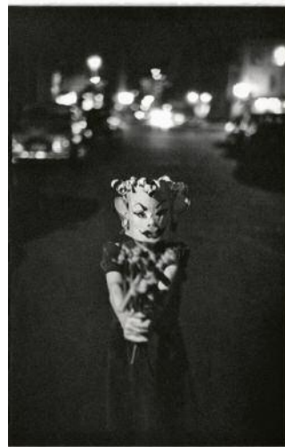
06_Saul Leiter, Halloween, ca. 1952