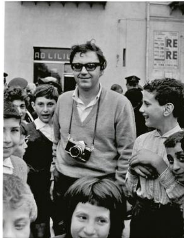
02_Leiter in Sicily, ca. 1960