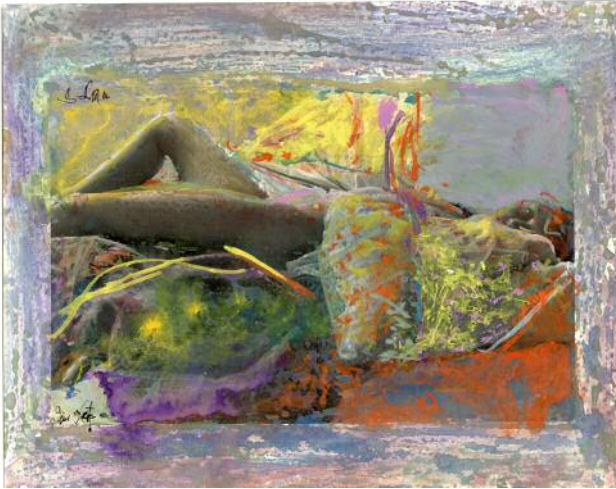
19_Saul Leiter, 19_Ohne Titel, undatiert. Gouache und Wasserfarbe auf Silbergelatineabzug, 8 x 10 inches © 2023 Saul Leiter Foundation