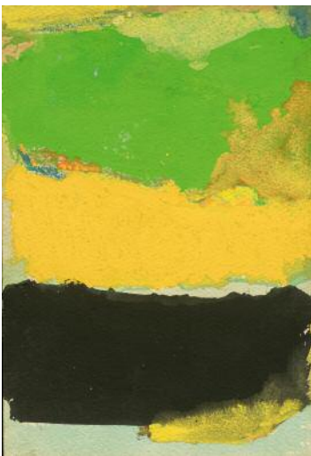
15_Saul Leiter, Ohne Titel, undatiert. Gouache und Wasserfarbe auf Papier, 26 x 18 cm