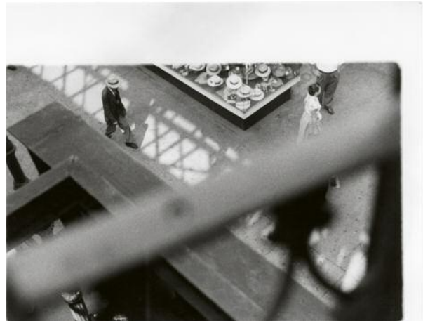
10_Saul Leiter, From the EI, 1950s