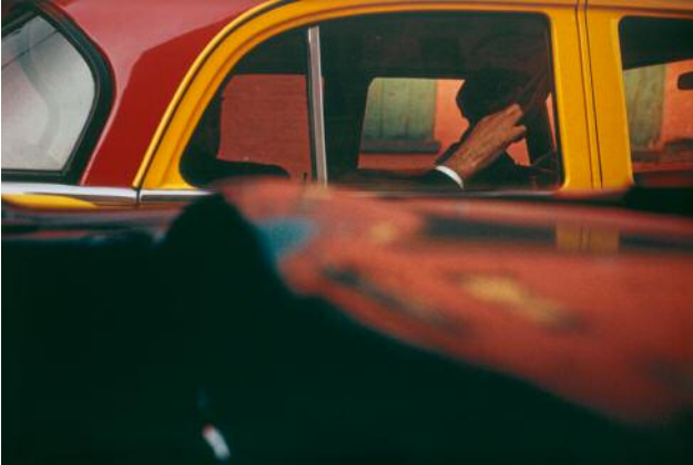
01_Saul Leiter, Taxi, 1957 © 2023 Saul Leiter Foundation