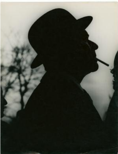
05_Saul Leiter, Wedding as a Funeral, 1951