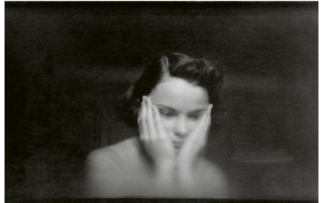
20_Saul Leiter, 20_Jean, ca. 1948