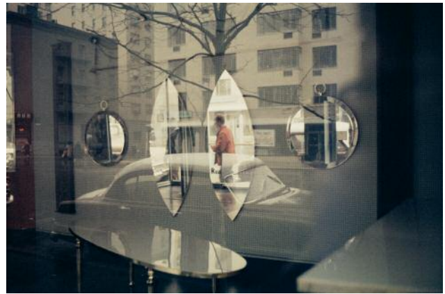
04_Saul Leiter, Mirrors, ca. 1962