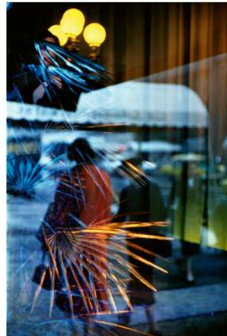
08_Saul Leiter, Ohne Titel, undatiert