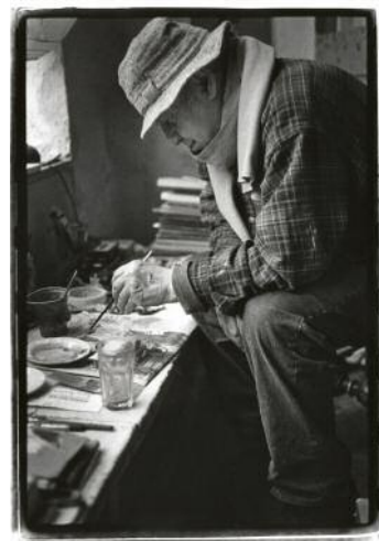
16_Saul Leiter, Leiter in seinem Studio, 2003.