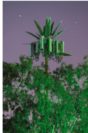
04_ © Işık Kaya & Thomas Georg Blank