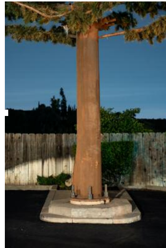
10_ © Işık Kaya & Thomas Georg Blank