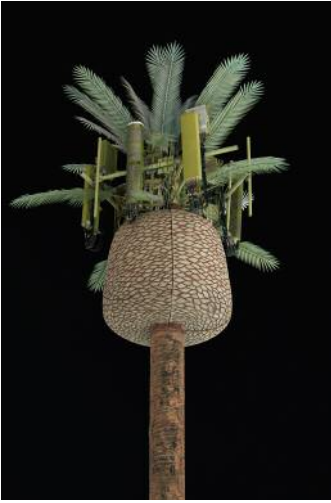
07_ © Işık Kaya & Thomas Georg Blank