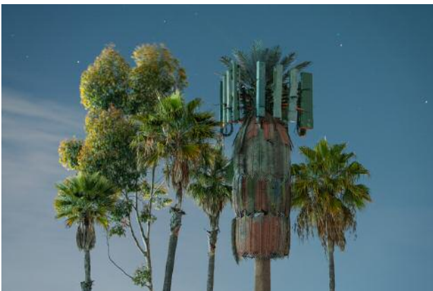
05_ © Işık Kaya & Thomas Georg Blank