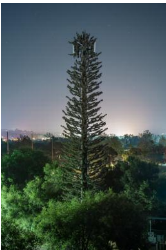
11_ © Işık Kaya & Thomas Georg Blank