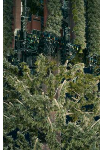
08_ © Işık Kaya & Thomas Georg Blank