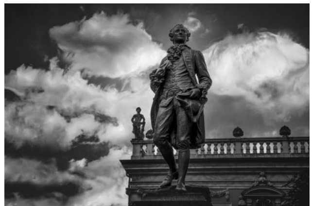
06_Goethe-Denkmal auf dem Naschmarkt vor der alten Börse in Leipzig