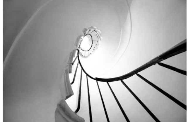
08_La Rotonda bei Vicenza, Italienische Reise