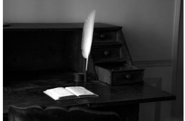
02_Jerusalemhaus, Feder und Schreibpult, Wetzlar