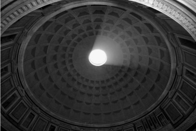
07_Pantheon in Rom, Italienische Reise