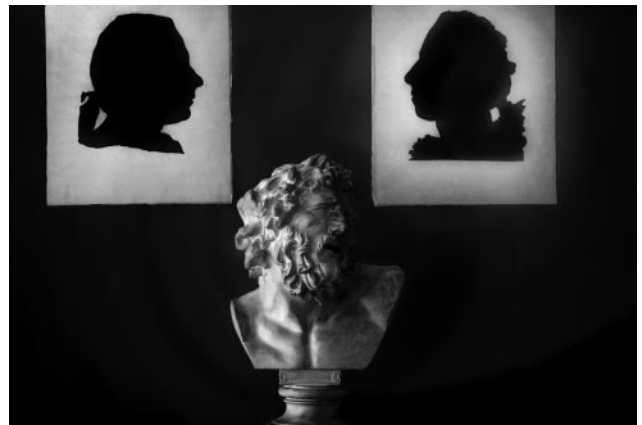
10_Scherenschnitte von Cornelia Friederica Christiana und Johann Caspar Goethe im Dichterzimmer, Frankfurt am Main