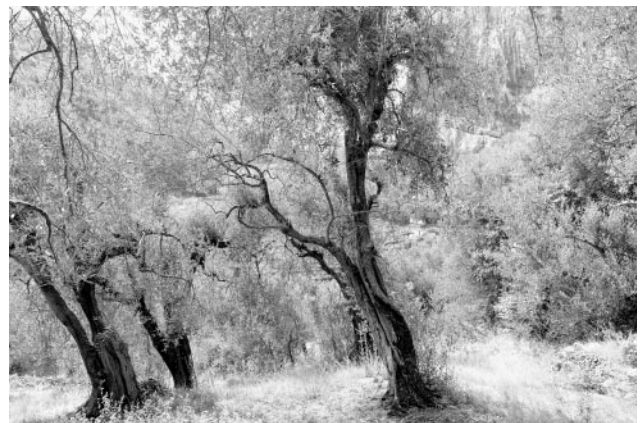
04_Torbole, Gardasee