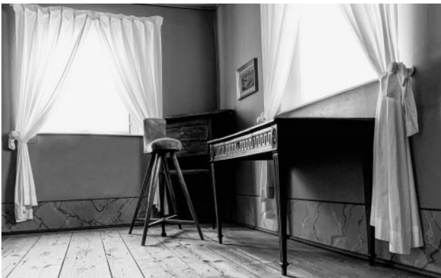
05_Goethes Arbeitszimmer im Gartenhaus, Weimar