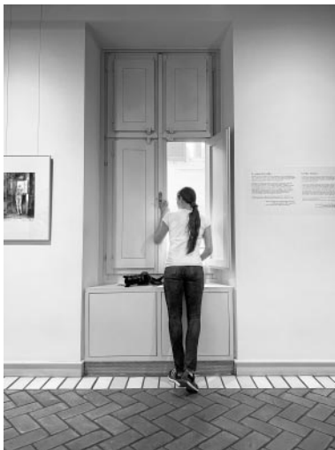
09_Selbstporträt in Goethes Wohnung im heutigen Museum Casa di Goethe