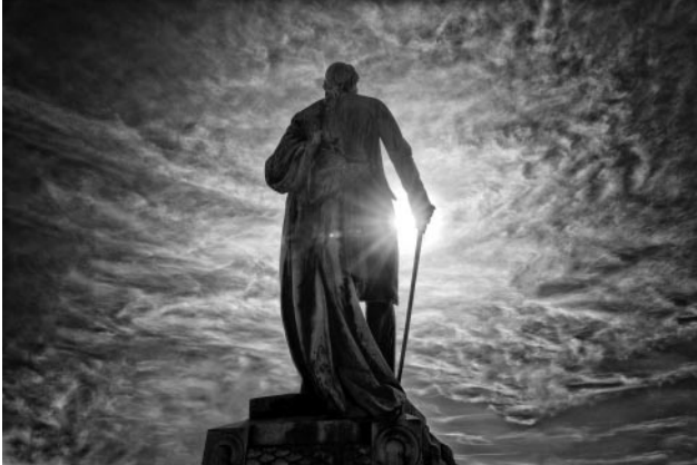
01_Goethe-Statue, Place de l'Université, Straßburg