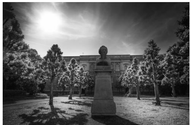
12_Goethe-Büste, Garten des Universitätsschlosses, Straßburg