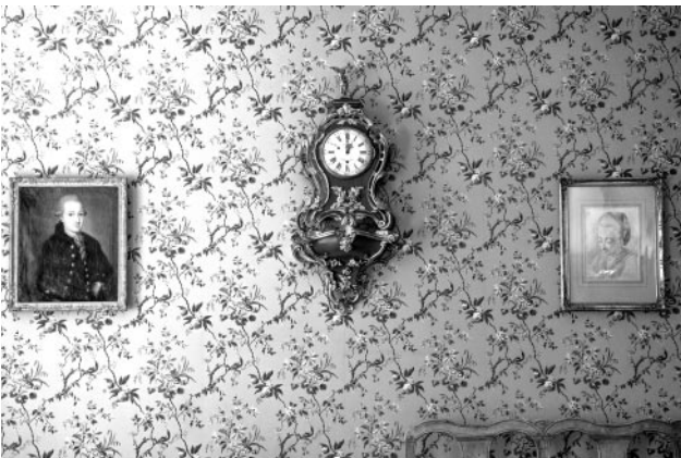
11_Zimmer von Goethes Schwester Cornelia Friederica Christiana, Frankfurt am Main