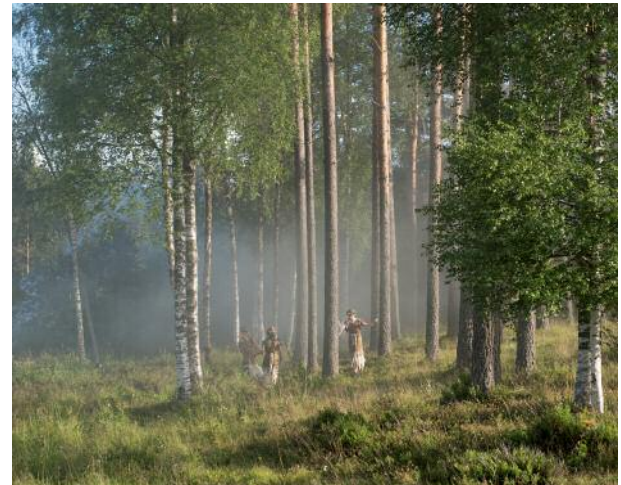
12 A declaration of independence for the The Republic of Finnskogen has taken place every second weekend in July since 1970. It is a three-day celebration of the region's Finnish heritage, complete with an outdoor theatre play. Svullrya 2016.