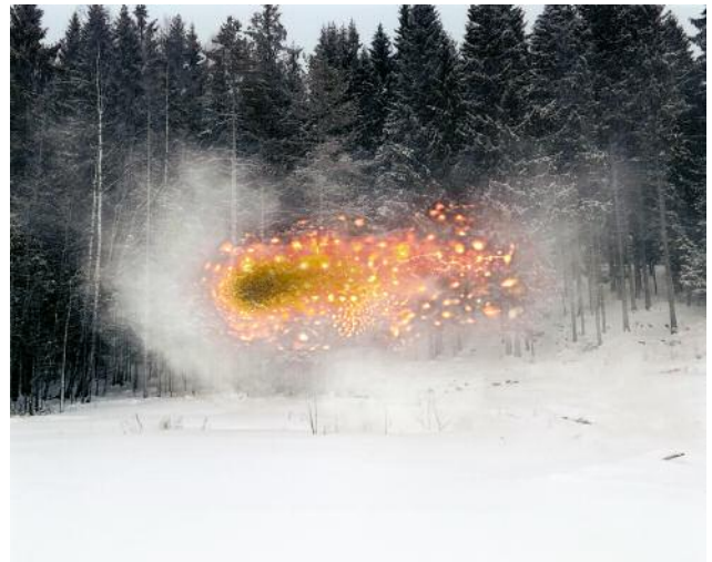
02 Lindalstorpet farm by Lake Skasen, one of the first farms to be settled in Finniskogen. Grue Finnskog 2016.