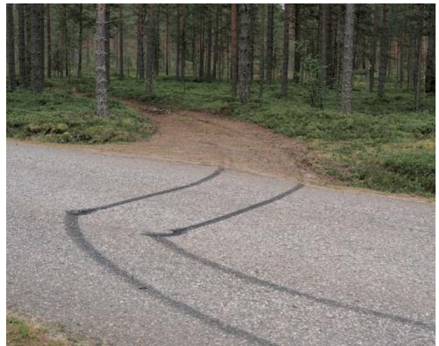
10 Skidmarks in the Savonia region, the epicentre of the Forest Finn migration in the 17th century. Finland 2015.