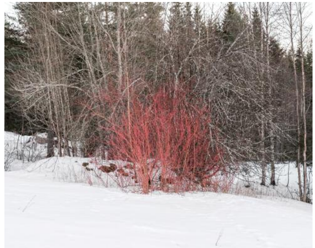
04 Red bush at Lindalstorpet farm. Grue Finnskog 2016.