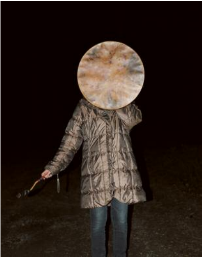
01 Woman with shaman drum. Svullrya 2015.