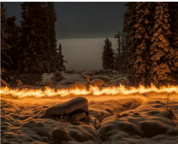
05 Border between Sweden (left) and Norway (right) at Moldusen. An approximately twenty-metre wide clearing in the forest separates the two Scandinavian nations, consequently cutting Finniskogen in two. Grue Finnskog 2016.