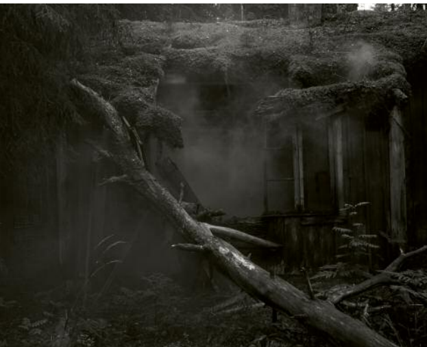
09 Abandoned house in Tiveden National Park, one of the southernmost areas populated by Forest Finns. Sweden 2016.