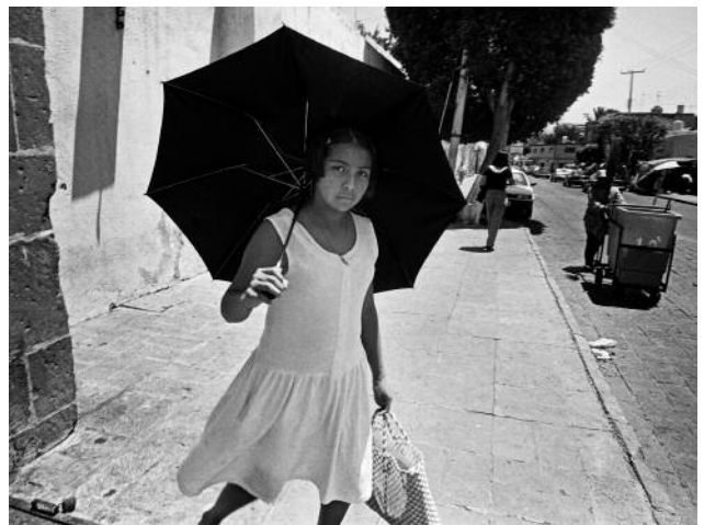
12 Young Woman Holding Umbrella, Querétaro, 1999