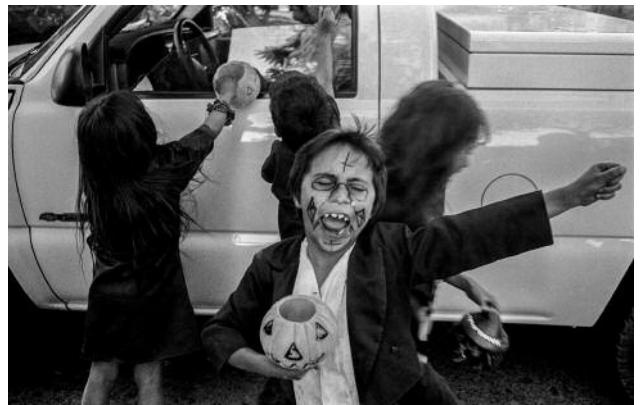
10 Boy with Outstretched Arm and Pumpkin, Morelia, 1999