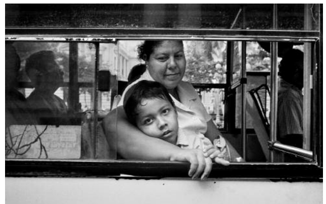
6 Woman and Child on Bus, Veracruz, 2007