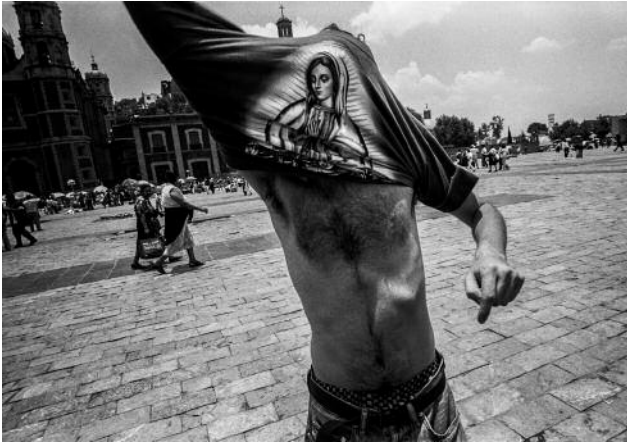
7 Man Putting on Guadalupe Shirt, Mexico City, 2000