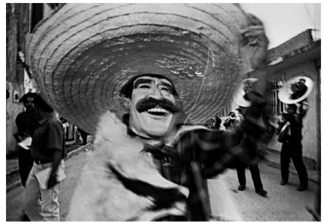
4 Man in President Fox Mask and Sombrero, Etlá, 2001