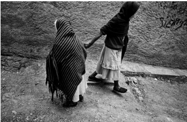
11 Two Women Passing Each Other, San Miguel de Allende, 1993 © Harvey Stein