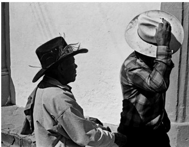
3 Two Men Wearing Sombreros, Atotonilco, 1997