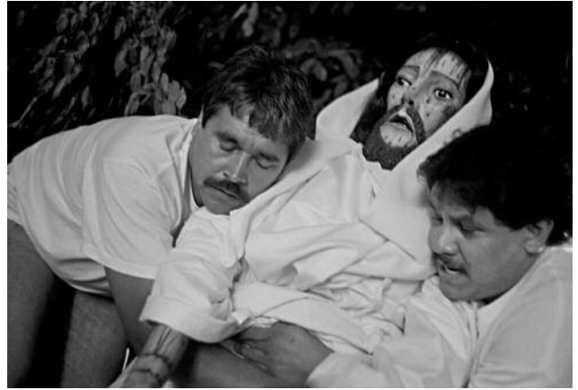
8 Holding Jesus, Taxco, 2003