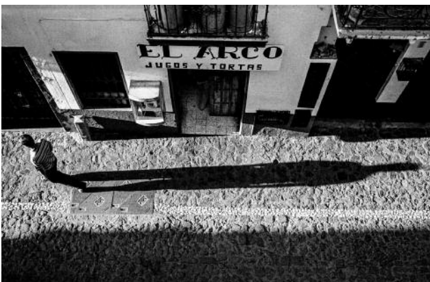
5 Man and Long Shadow from Above, Taxco, 2009