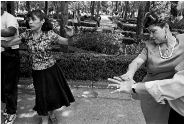
1 Two Couples Dancing the Danzón, Mexico City, 2000