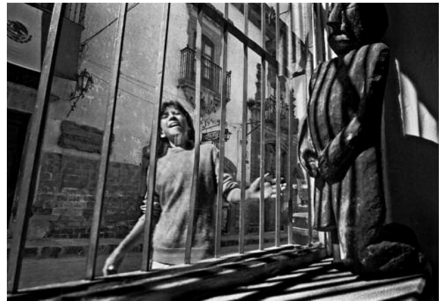
2 Woman Outside Window, San Miguel de Allende, 1995