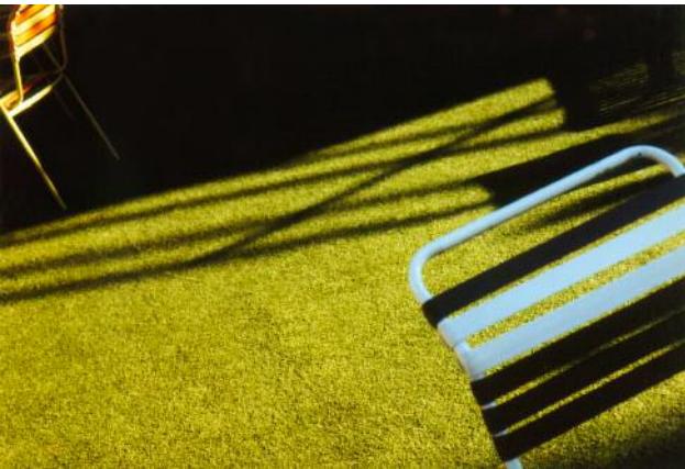
03 Aus der Serie Pictures Follow Me © Gabrielle Strijewski