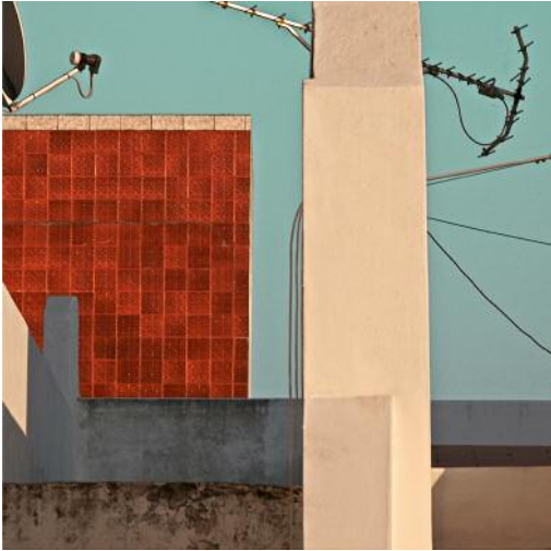
01 Aus der Serie Thirteen Metres over the Horizon