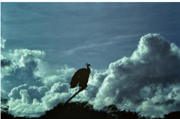
11 Aus der Serie Coming Up in the Far Distance © Gabrielle Strijewski