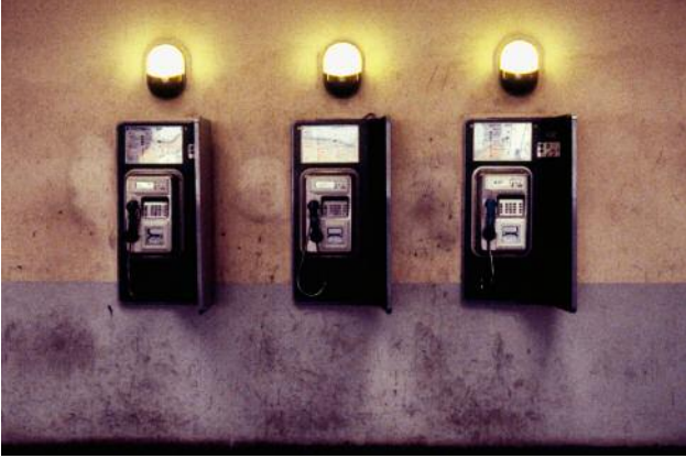
07 Aus der Serie Time Line © Gabrielle Strijewski