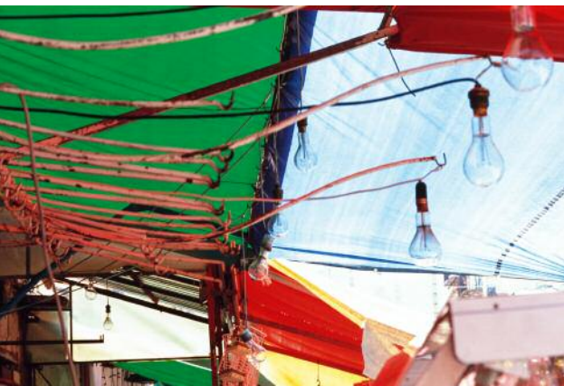
05 Aus der Serie Jewels in the Sky