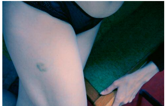
12 Aus der Serie A Change of Temperature