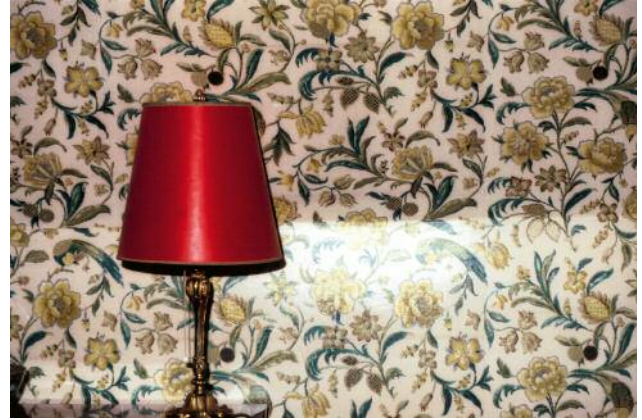
08 Aus der Serie What Happened and What Could Happen