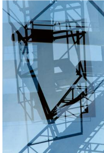
02 Aus der Serie Invisible Cities