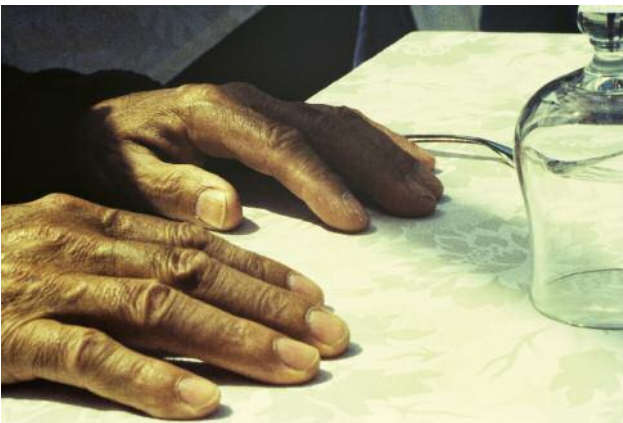
09 Aus der Serie What Happened and What Could Happen © Gabrielle Strijewski