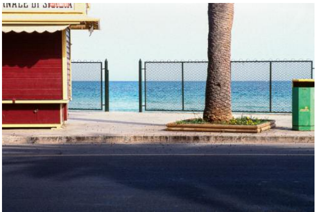
06 Aus der Serie One or Two Steps to the Side © Gabrielle Strijewski