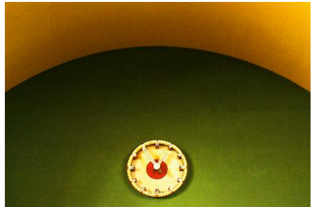
10 Aus der Serie Time Line © Gabrielle Strijewski