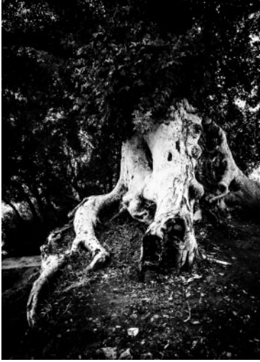
07_© Benita Suchodrev