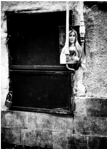
11_© Benita Suchodrev