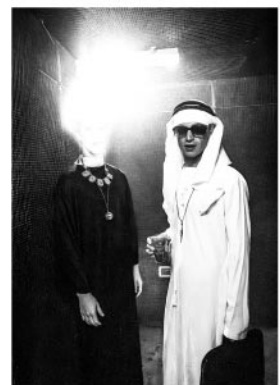
06_© Benita Suchodrev