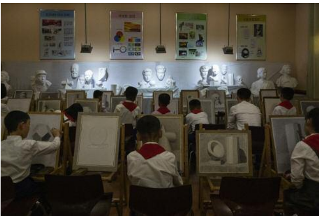
11_Drawing class at the Mangyongdae Schoolchildren's Palace in Pyongyang, the largest facility for children's after-school activities in North Korea.