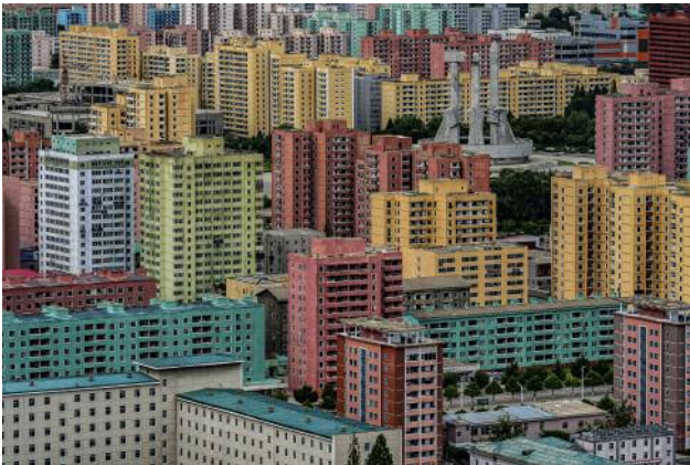
09_City view taken from the Tower of Juche Idea, Pyongyang. The Monument to Party Founding, top right of the image, portrays a worker, a farmer, and an intellectual holding hammer, sickle, and brush, respectively.