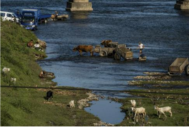
07_People wash cars and collect gravel at a riverbank on the road between Ulim Waterfalls and Hamhung in the country's east.