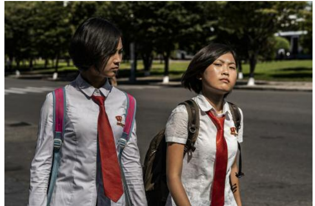
10_School girls, Pyongyang.