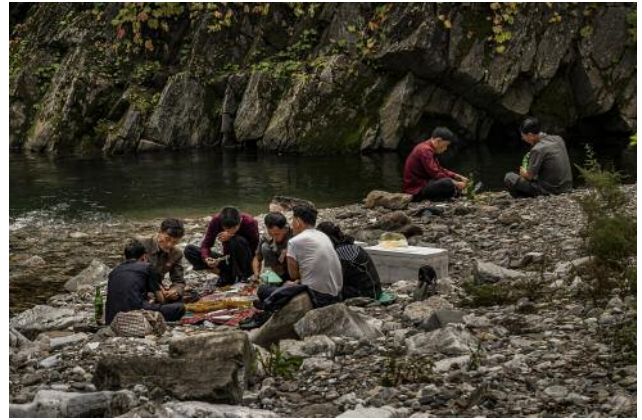
08_People have a picnic near the Ulim Waterfalls, named after the Korean word for echo, as its rumbling sound resonates across a four-kilometre radius.