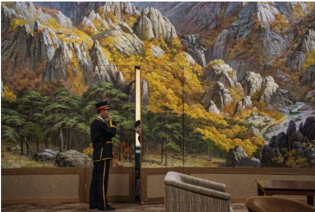
03_ A porter and a woman in the Kumgangsan Hotel at Mt Kumgang, This hotel is known for hosting reunion meetings between families from North and South Korea.