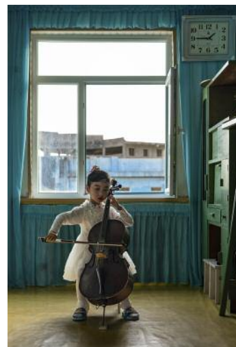
12_Girl plays a cello at Chongam Kindergarten, Chongjin.