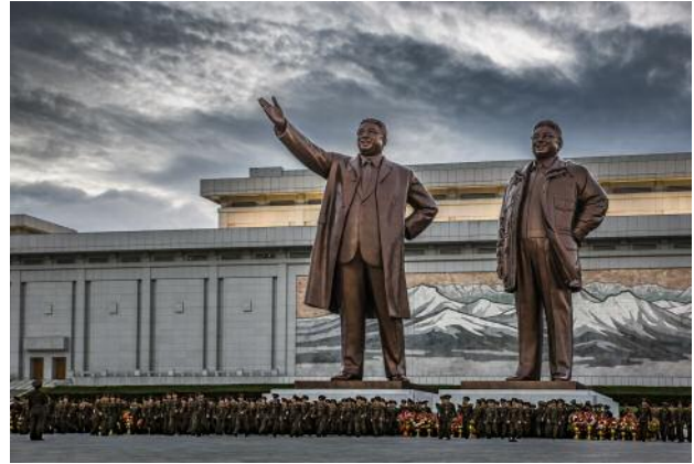
02_ The Mansudae Grand Monument, located in Pyongyang, features massive bronze statue of President Kim Il Sung and General Kim Jong Il. The image was taken the day before Liberation Day when military personnel visited the monument to lay flowers in honour of the leaders.