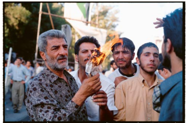
06_Students asking for reforms during a protest in Tehran. (Tehran, 1999)