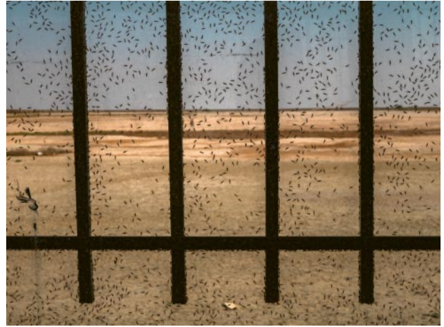
08_Uremia, 2017 © Newsha Tavakolian