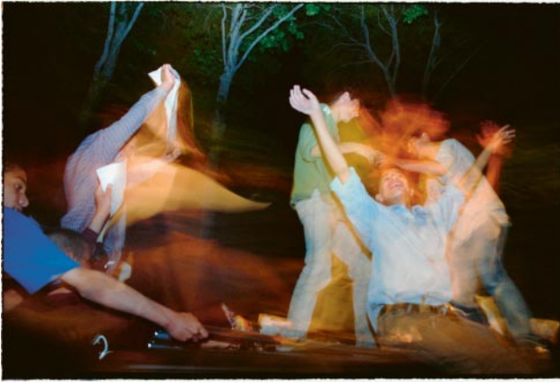
07_The election campaign. (Tehran, 2000)