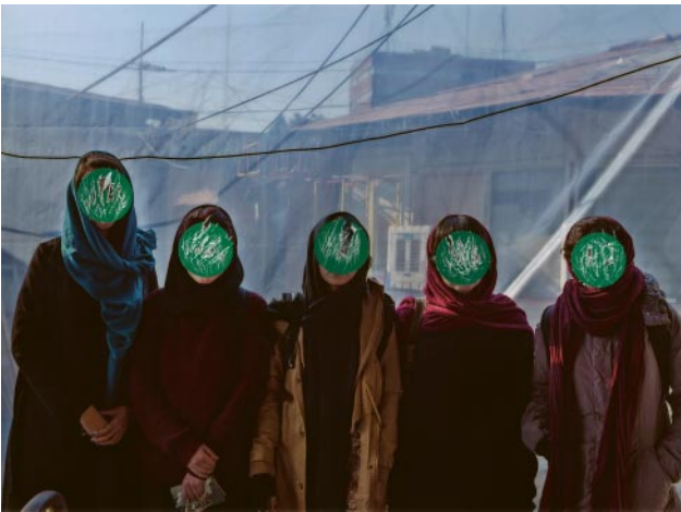
09_Tehran, 2017