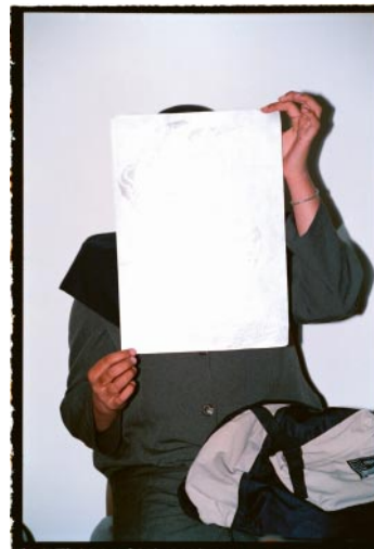
04_A girl hiding her face, in a special shelter for vulnerable women. (Tehran, 1998)