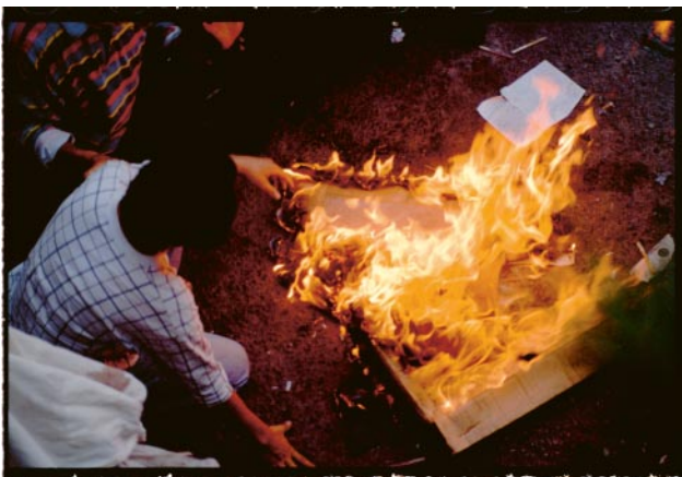
05_After riot police used tear gas, protesters burnt cardboard to use the smoke to drive the tear gas away. (Tehran, 1999)