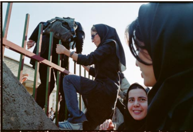
03_This is the first time I saw other girls climbing a fence to join a student protest. (Tehran, 1999)