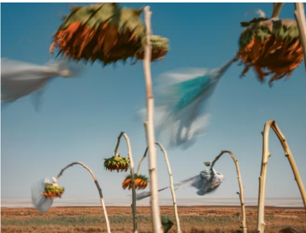
11_Uremia, 2017