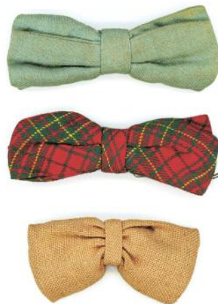
12_ © Christopher Taylor