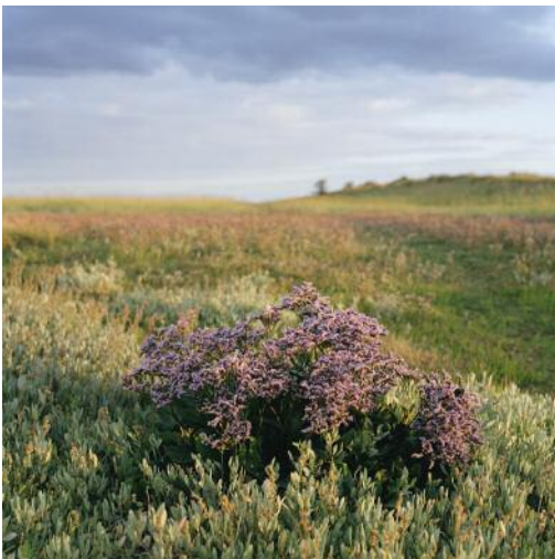
03_ © Christopher Taylor