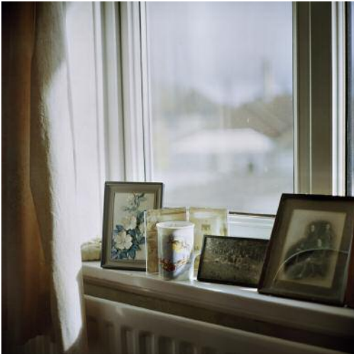
07_ © Christopher Taylor