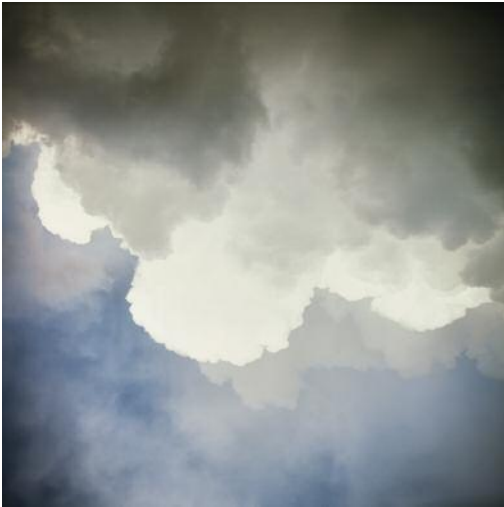
01_ © Christopher Taylor