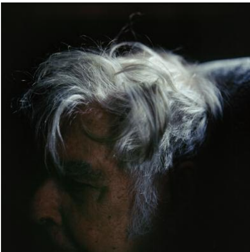
09_ © Christopher Taylor