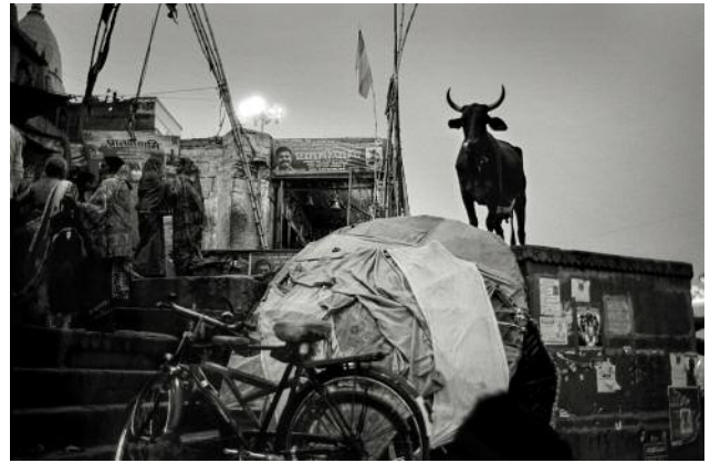
08 Varanasi, 2017