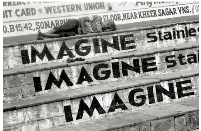
02 Varanasi, 2010