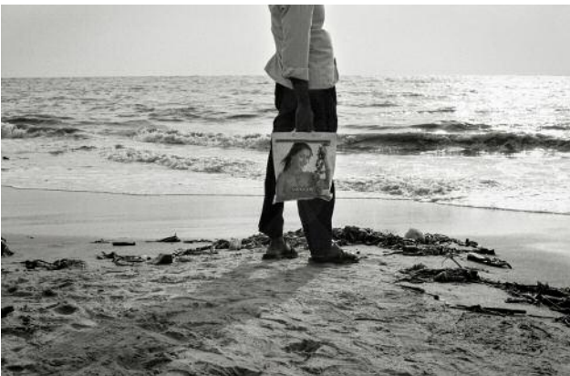
05 Kochi, 2009