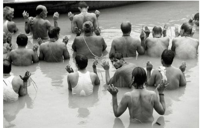
06 Varanasi, 2010