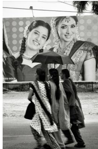
12 Alappuzha, 2009