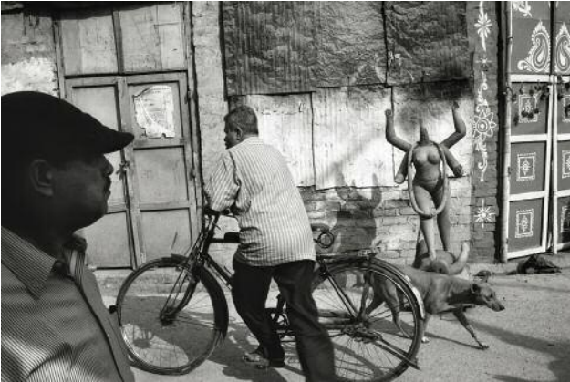
07 Kolkata, 2010