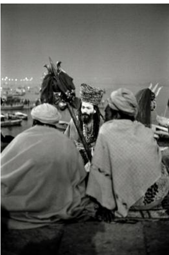
11 Varanasi, 2017