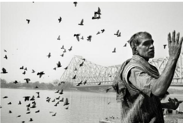
03 Kolkata, 2010