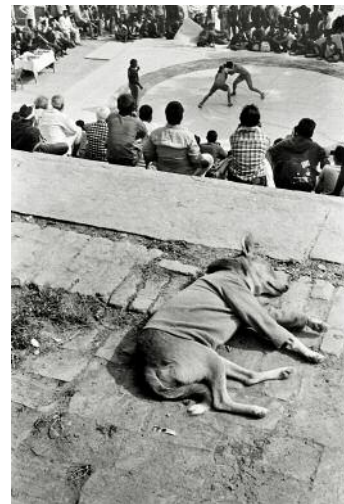
10 Varanasi, 2017