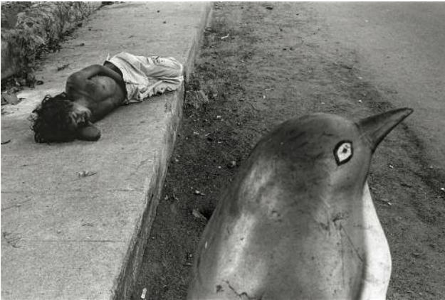
01 Mamallapuram, 2011