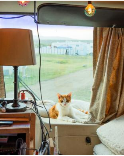
07_ ALLISON ROGERS (Katze)