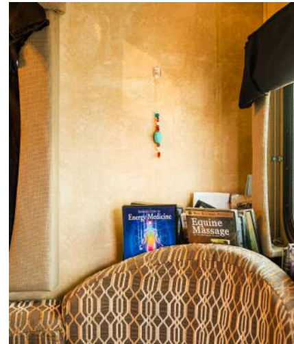
12_ DVDs