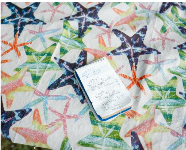
05_BRENDA CURTIS (Liste)