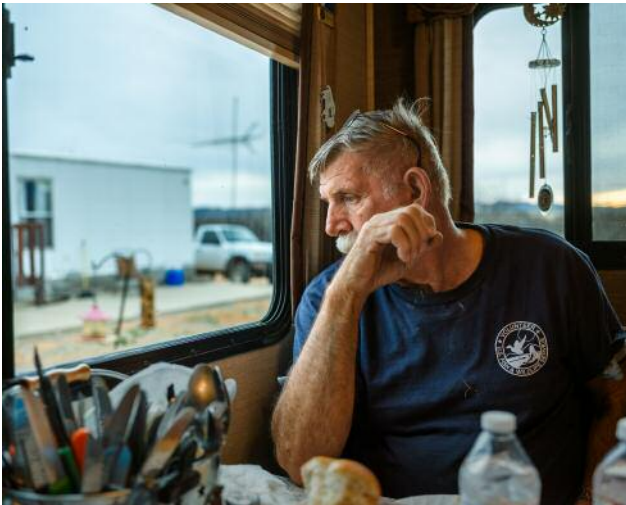
01_HENRY BORUCH © Timothy Eastman