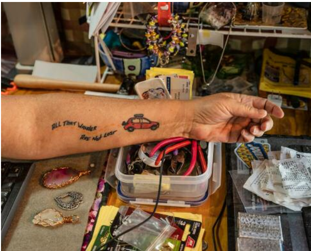
03_LYSIANNE EVANS