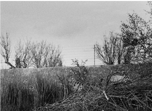
05 © Tomeu Coll