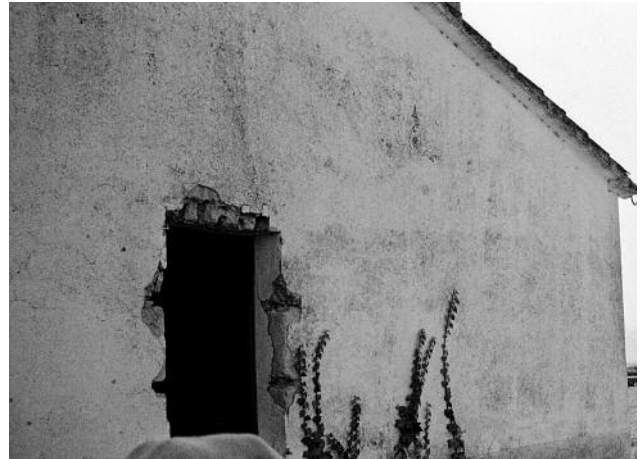
10 © Tomeu Coll