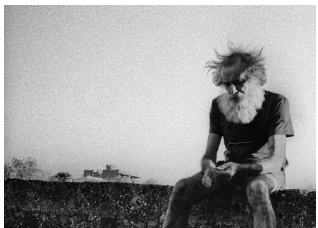
06 © Tomeu Coll