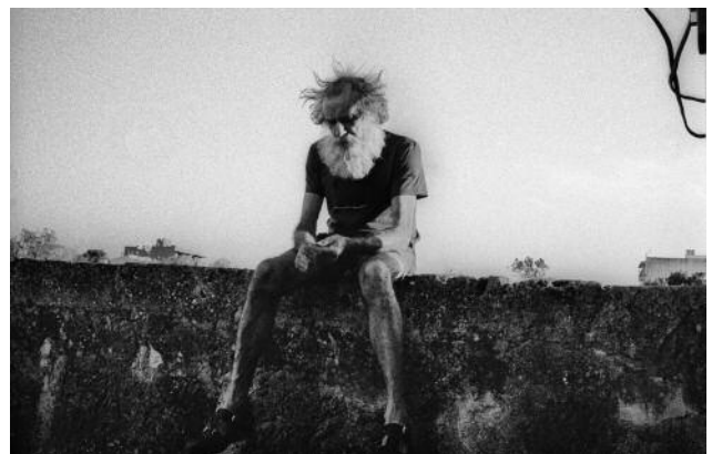
06 © Tomeu Coll