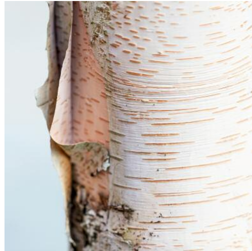
08_Untitled 4174, 2019