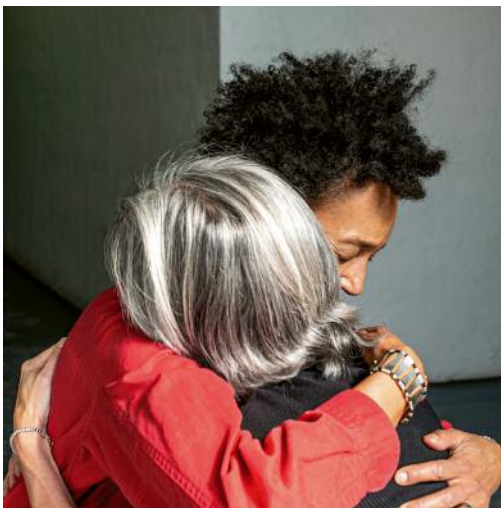
11_Untitled 7336, 2020