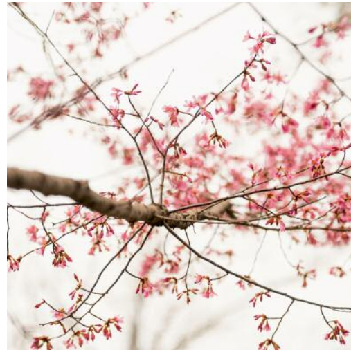
04_Untitled 51567, 2013