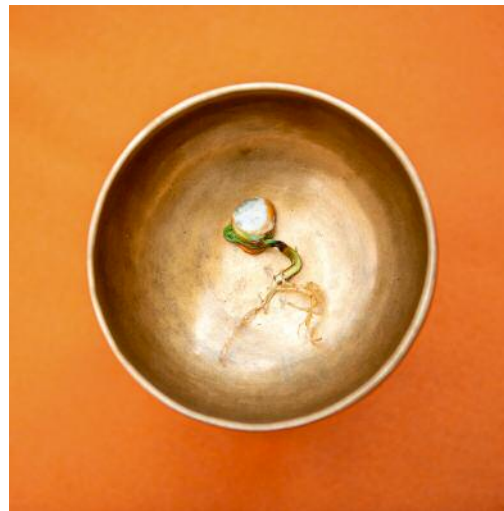
10_Untitled 6293, 2021 © Torrance York