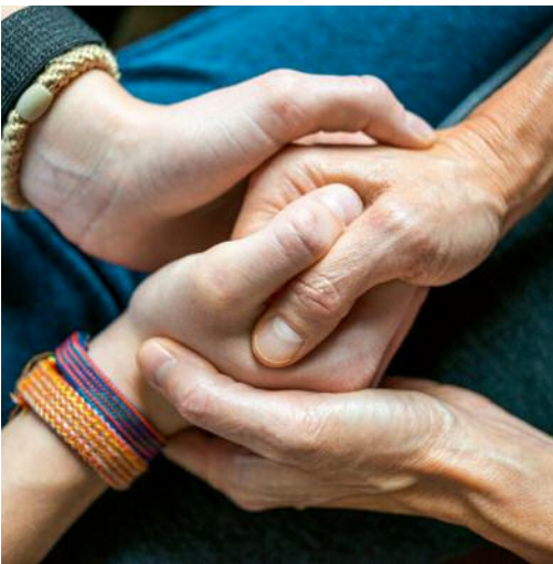
09_Untitled 8019, 2020