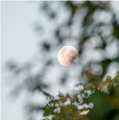
01_Untitled 1618, 2020 © Torrance York