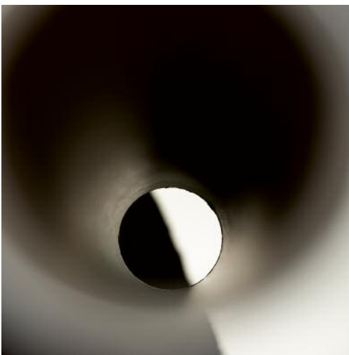
05_Untitled 9390, 2020 © Torrance York