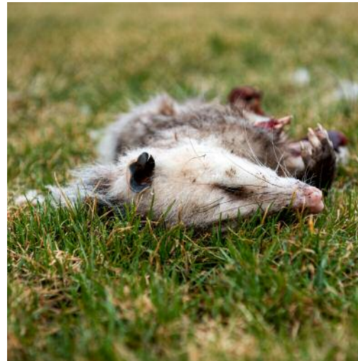
12_Untitled 6201, 2020 © Torrance York