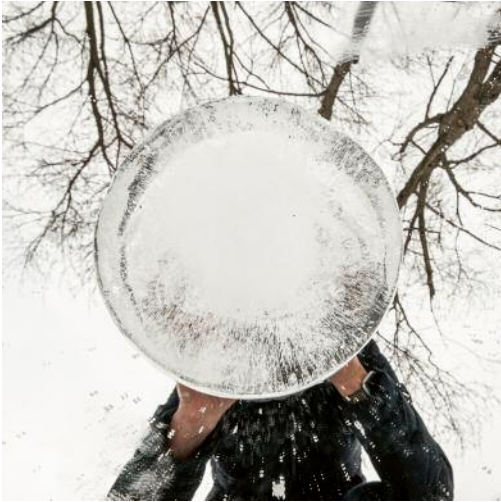
07_Untitled 5365, 2021