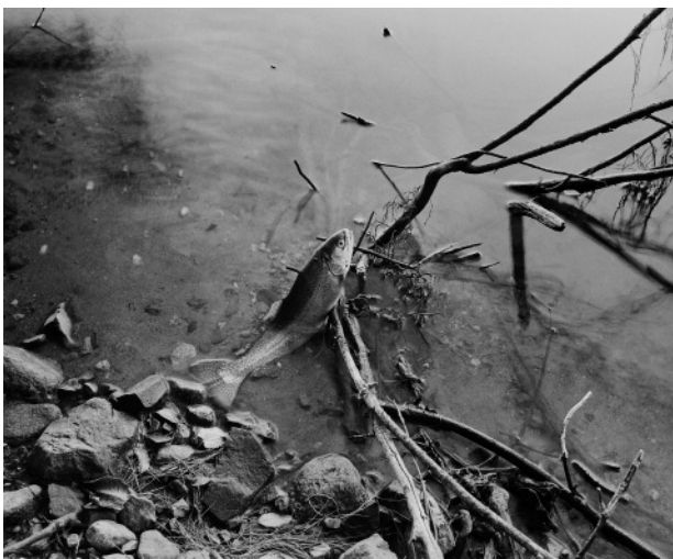
3. Trout, pond stocked by the state, July 2011