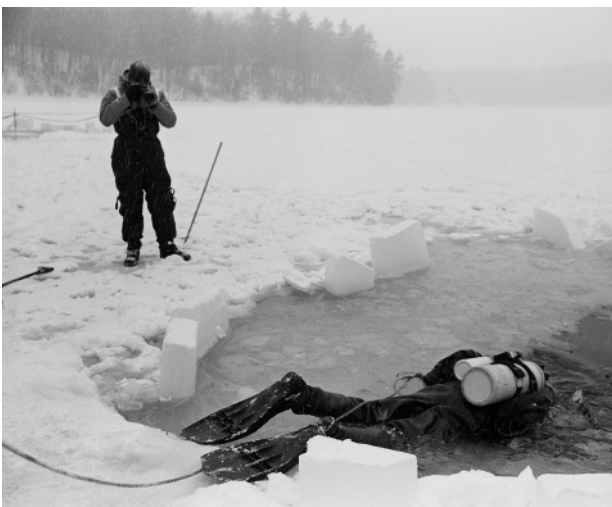
5. Massachusetts State Trooper under water recovery training, February 2014