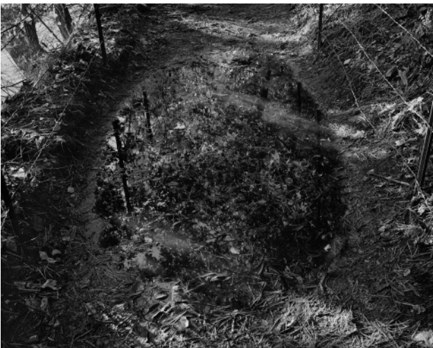
11. Puddle, November 2011