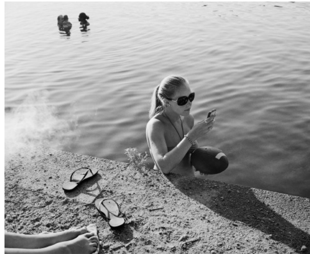
10. Phone, Football, Smoke, July 2010