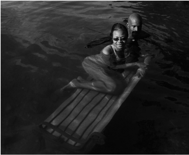
7. Submerged park bench, high-water, bathers, August 2010