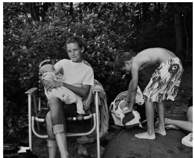
4. Mothering, August 2011