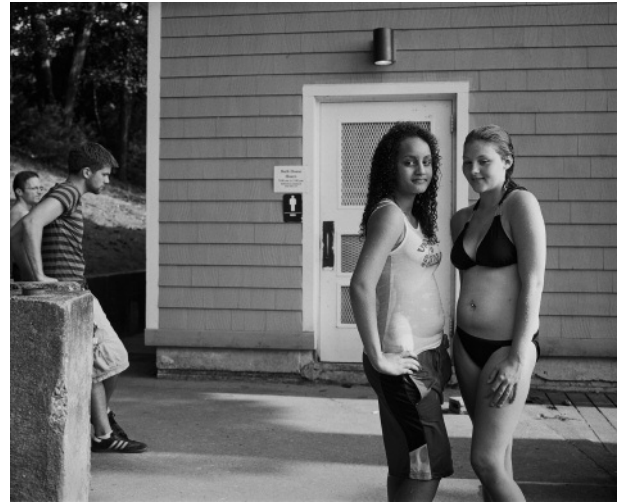
8. Girls posing by the bath house, July 2010