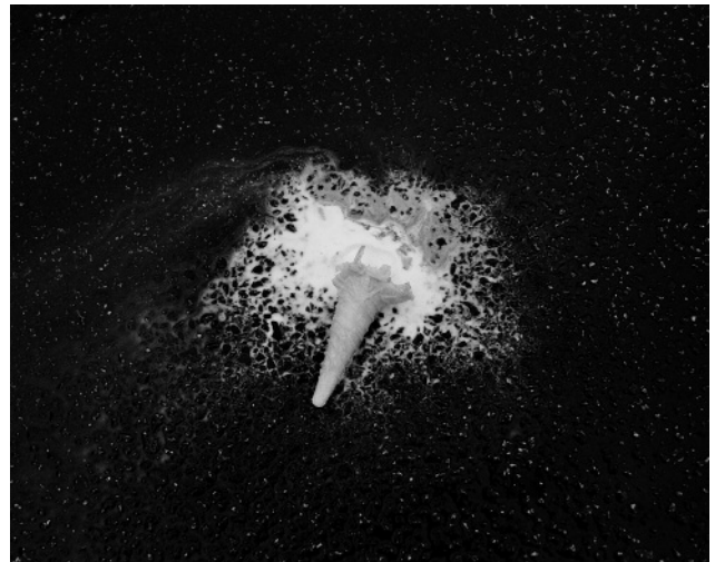
2. The Milky Way, October 2010