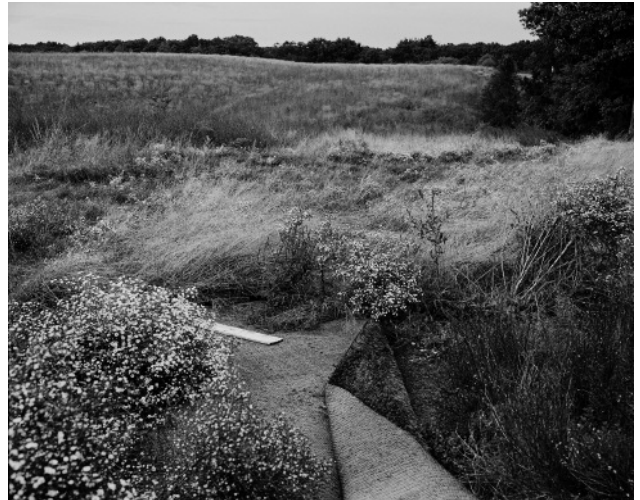
14. Astro turf, Concord landfill, October 2011