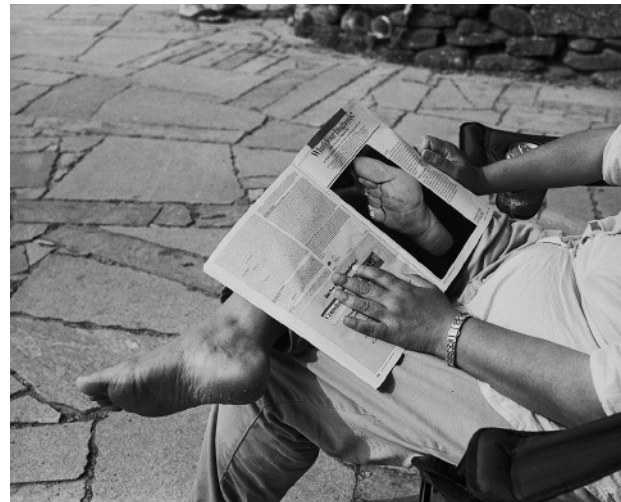
12. Whats your diagnosis?, August 2010 © S.B. Walker