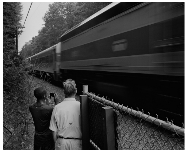
6. The Fitchburg railroad, 40 ft. from ponds edge, onlookers, August 2012