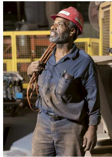
04 Andrew Phelps: Charlie Ross, Wienerberger, Brickhaven , 2017 © Andrew Phelps