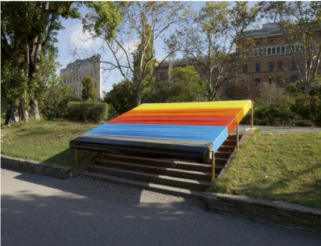
07 Marlon de Azambuja: 1 Potencial Escultórico , 2018 © Marlon de Azambuja