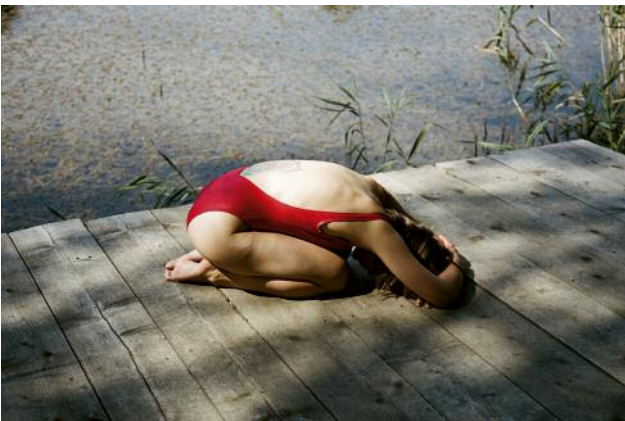
09 Paul Kranzler: Blauer Teich 2018, Junge Frau in rotem Badeanzug in Stellung des Kindes