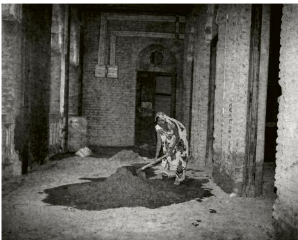
05 Alicja Dobrucka, Untitled 7 , 201