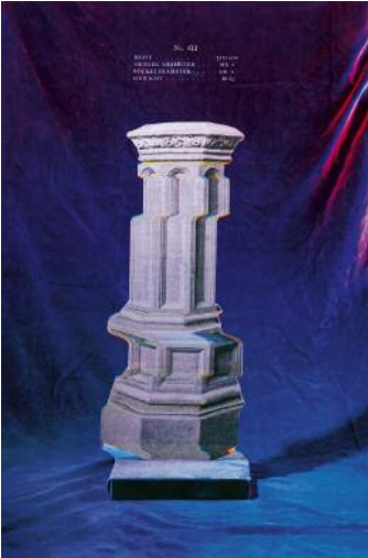
01 Thomas Albdorf: Musterbuch Nr. 412 , 2018 © Thomas Albdorf