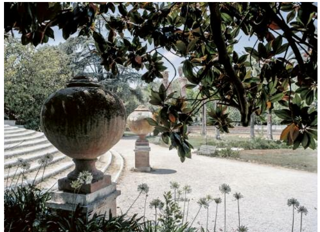
06 Andrea Witzmann, fino in fondo 3 , 2017