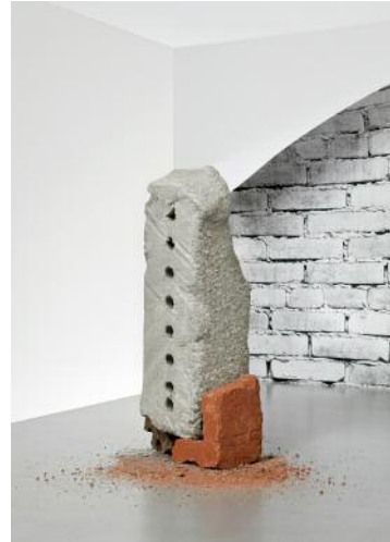
08 Anu Vathra, Untitled Monolith III , 2018 © Anu Vathra