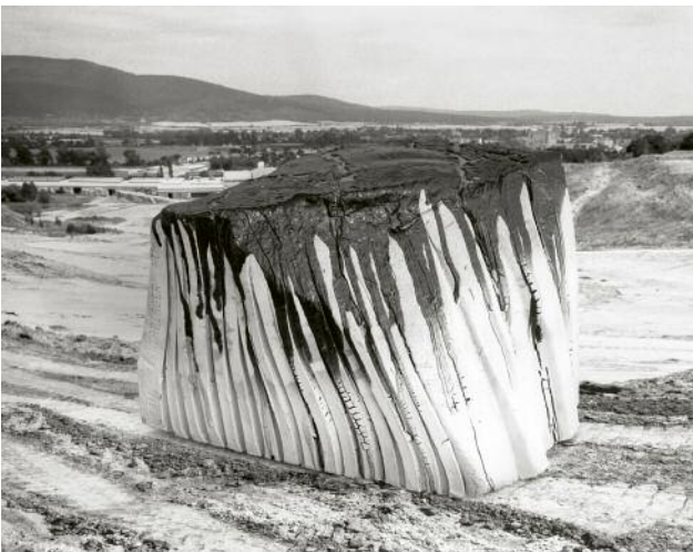
03 Taiyo Onorato & Nico Krebs: Brick 5 , 2017