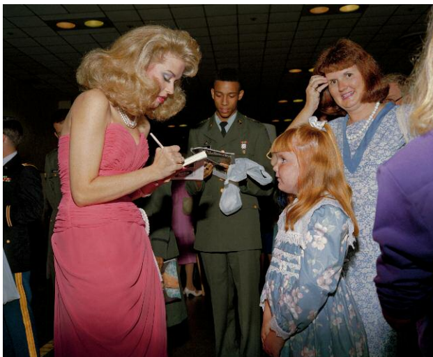
09 Autograph, Mother / Daughter, Miss America Pageant, Atlantic City, 1989