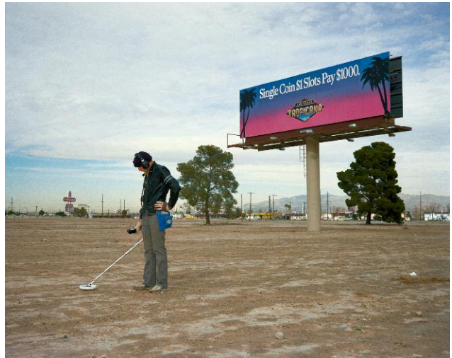
02 Fortune Hunter, Las Vegas, 1988