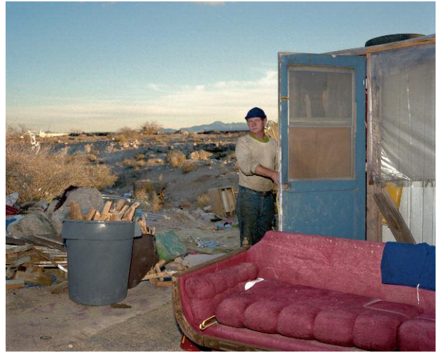
08 Desert Man, Red Couch, Las Vegas, 1988