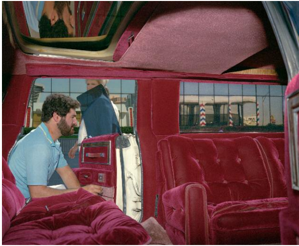
07 Man, Velour Limo, Las Vegas, 1988