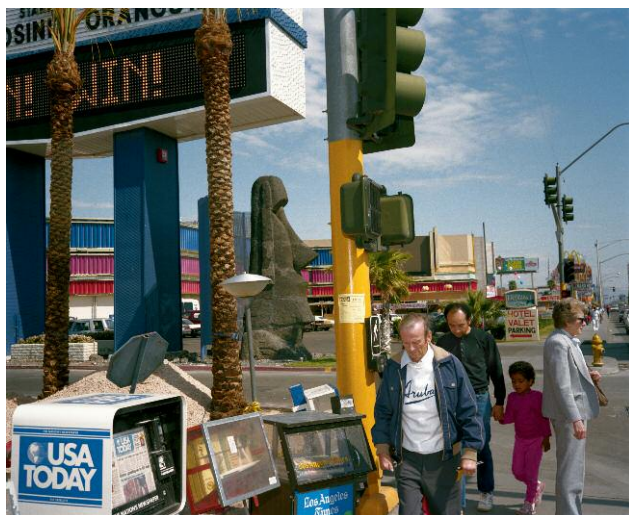
05 USA Today, Moai, Las Vegas, 1987