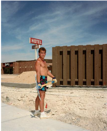
01 Worker with Pick, Las Vegas, 1987