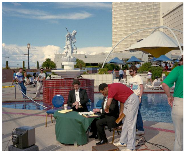
10 Sportscasters before Hagler / Leonard Prizefight, Ceasars Palace Pool, Las Vegas, 1987