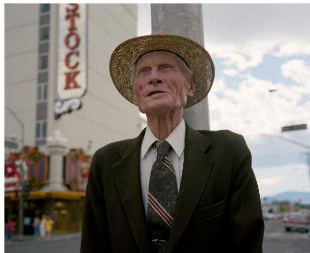
12 Ninety-Four-Year-Old Lawyer, Reno, 1991