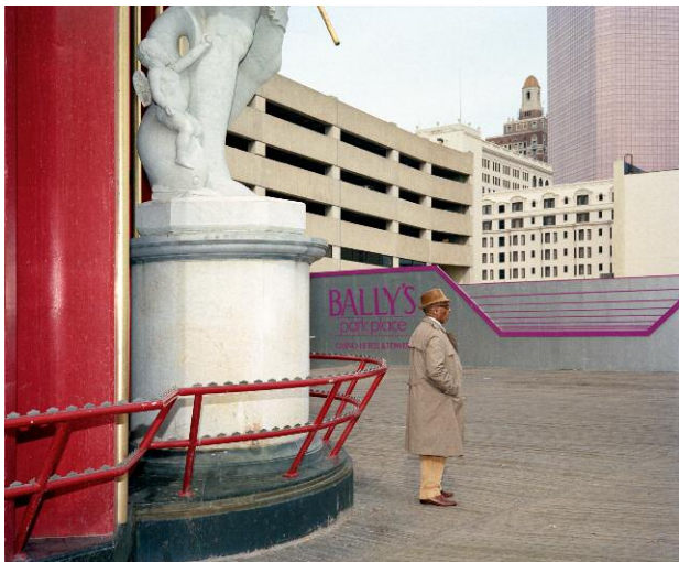
03 Man in Trench Coat, Atlantic City, 1989