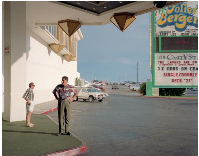
04 Valet Pickup, Las Vegas, 1992