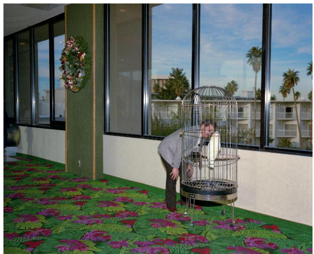
06 82 Man, Parrot, Las Vegas, 1988