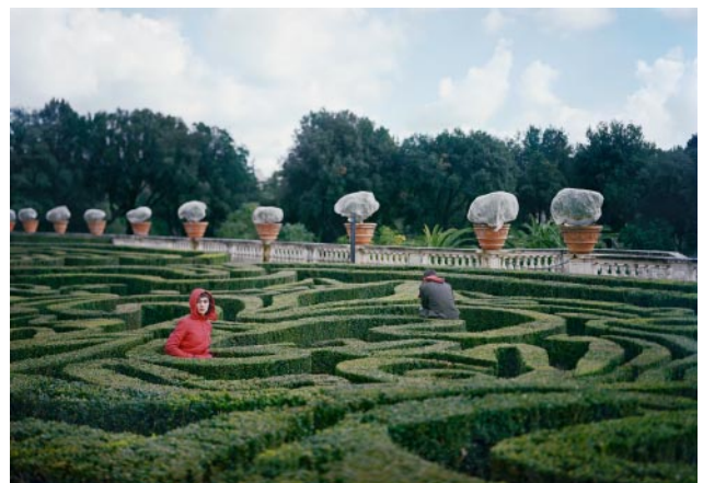
12_Noemí, Joseant, 2010 © Yolanda del Amo