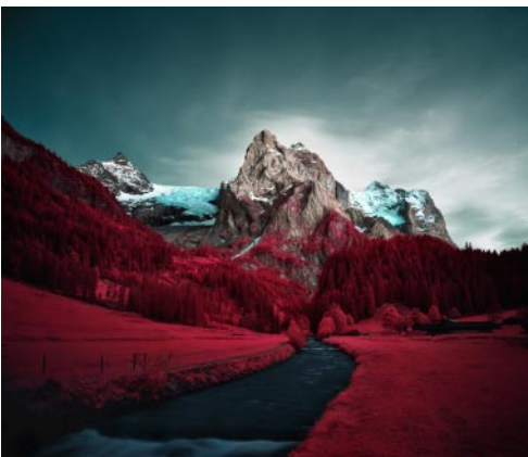
11_ Wetterhorn. 2019