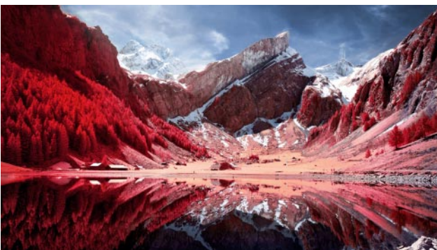
05_ Seealpsee, Appenzell. 2016