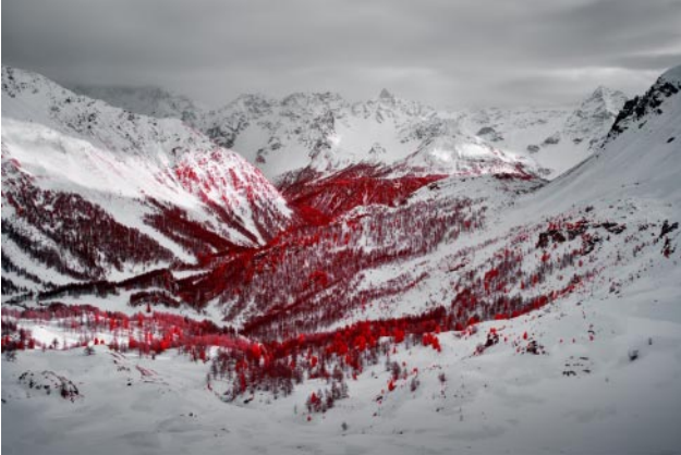
01_ Piz dal Teo, Grisons. 2018