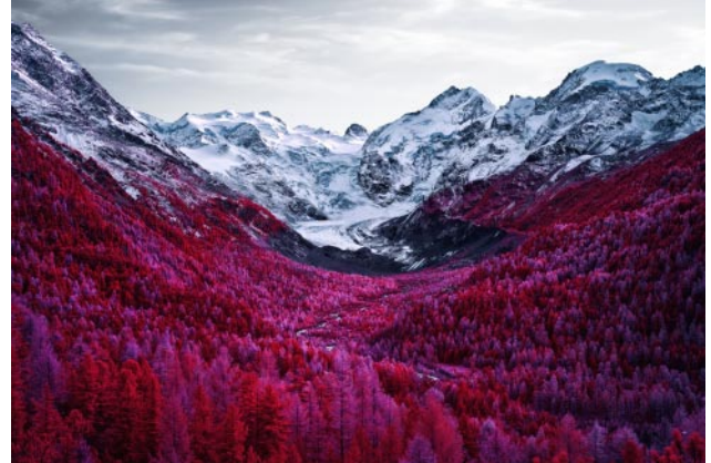
02_ Morteratsch, Grisons. 2019