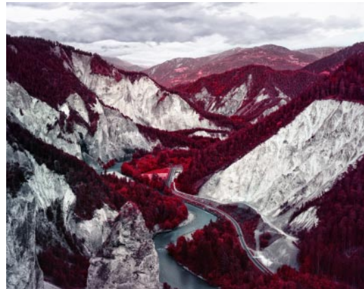
04_ Rheinschlucht. 2019