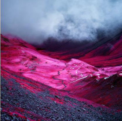
07_ Plessur. 2016