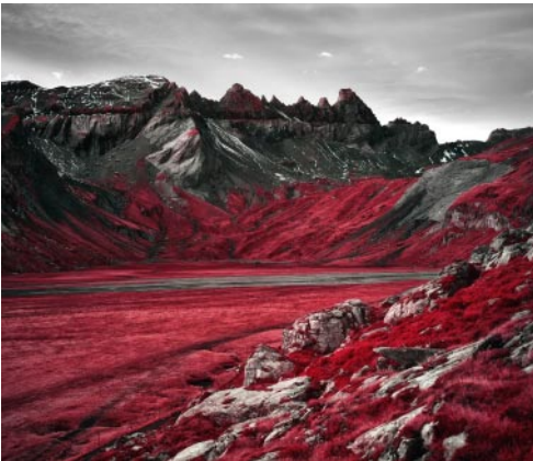
09_ Sardona, Grisons. 2021