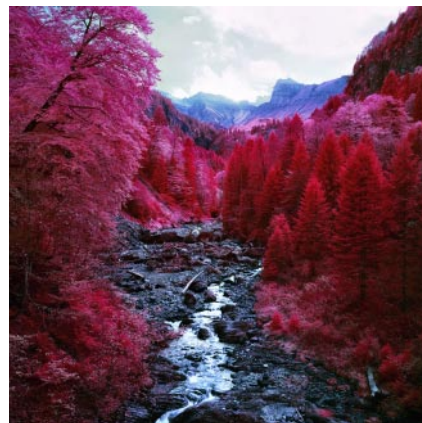
06_ Sihl, Schwyz. 2017