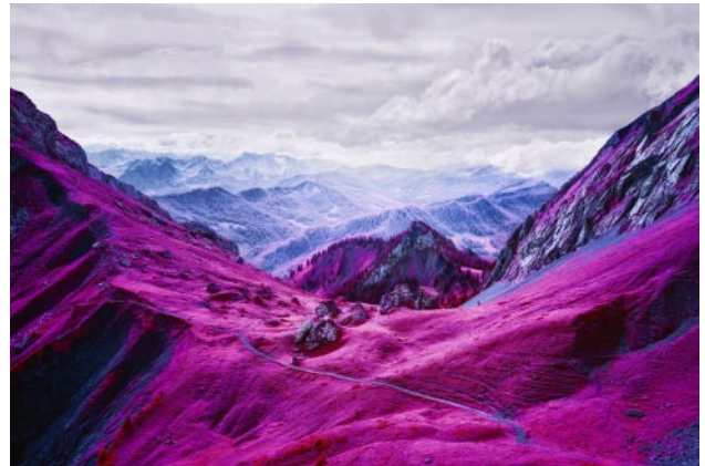
10_ View from Pilatus, Luzern. 2017 © Zak van Biljon