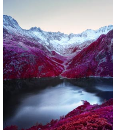
08_ Dammagletscher, Uri. 2020