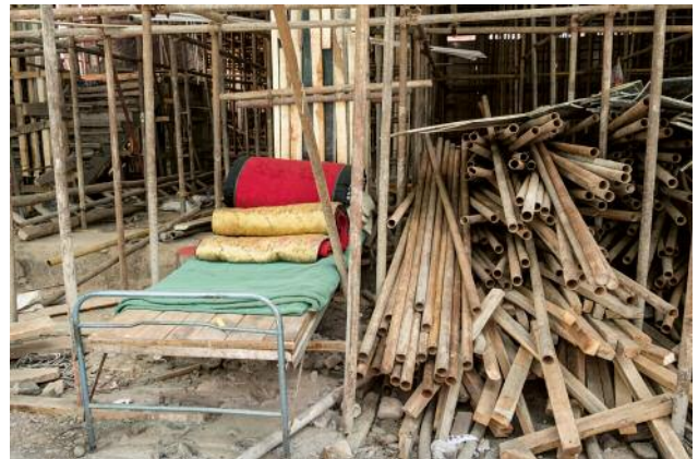
04 © Rosemarie Zens