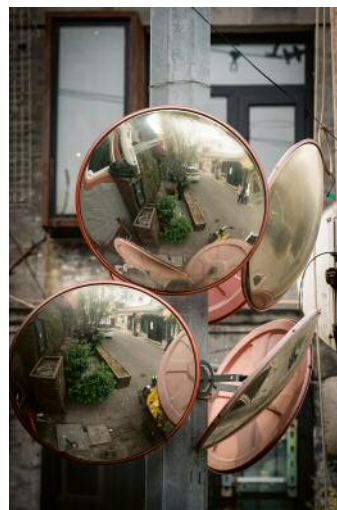
12 © Rosemarie Zens