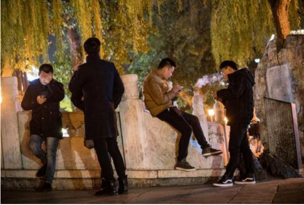
07 © Rosemarie Zens