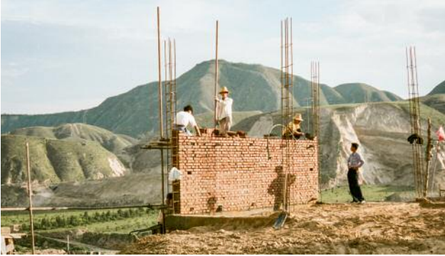
01 © Rosemarie Zens