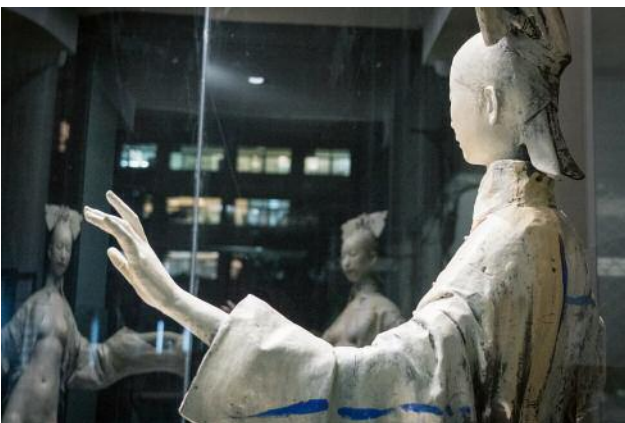
05 © Rosemarie Zens