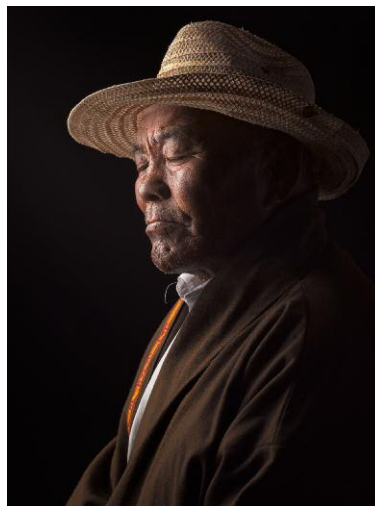
12. Choeying Tsamchoe © David Zimmerman