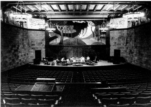
3_ The Hub; dress rehearsal at Mills College, Oakland, CA, October 6, 1989