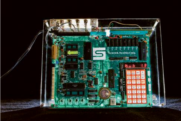
1_ The "glass" hub, one of the two hubs built in 1987 by Tim Perkis