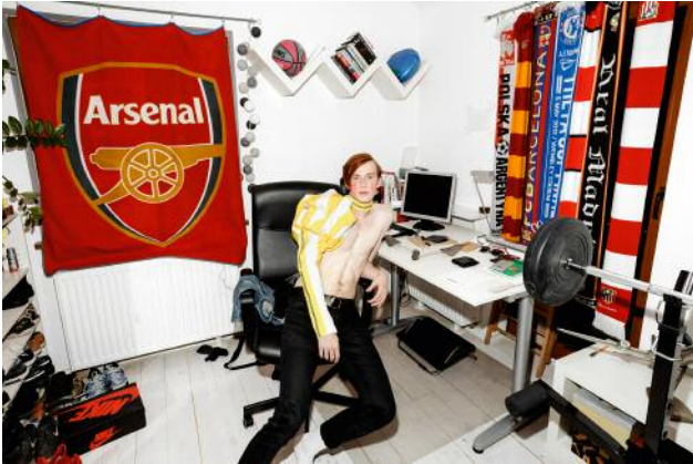
07 © Zosia Promińska