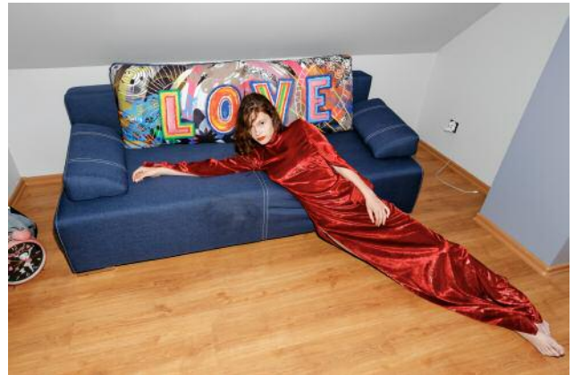
04 © Zosia Promińska