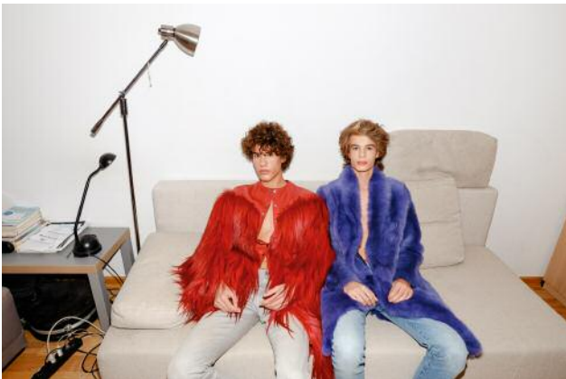
03 © Zosia Promińska