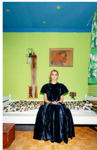
06 © Zosia Promińska