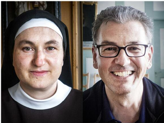
Iter nos perficit