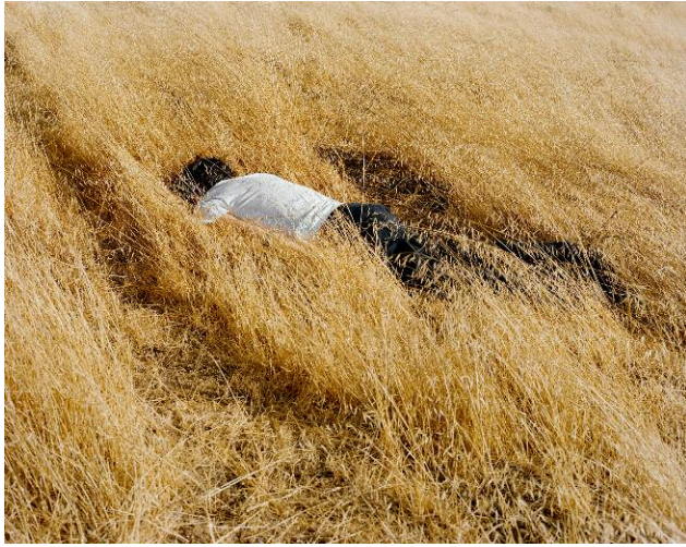
07 © Ahndraya Parlato