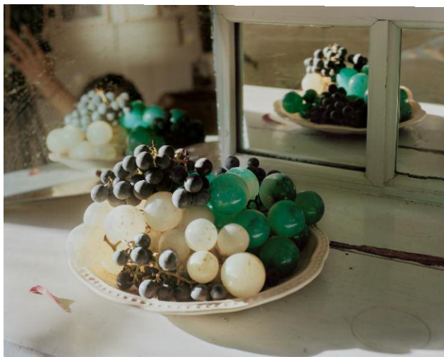
03 © Ahndraya Parlato