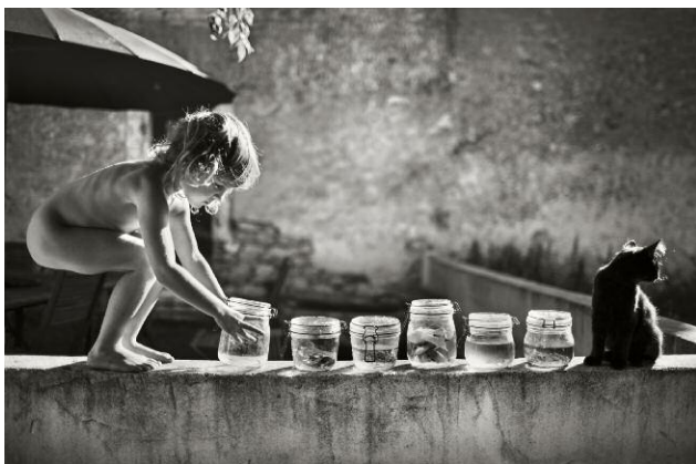
5. © Alain Laboile