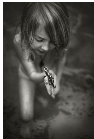
12. © Alain Laboile