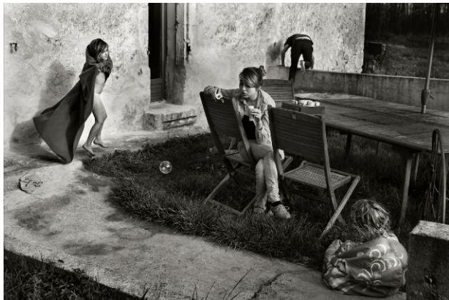
3. © Alain Laboile