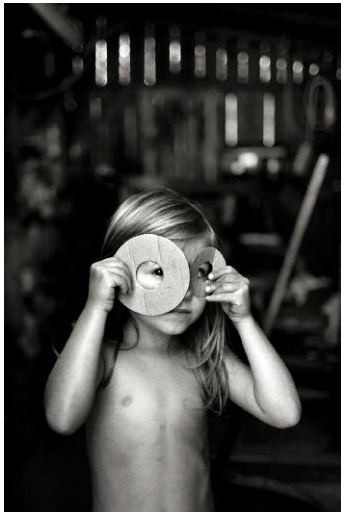
7. © Alain Laboile