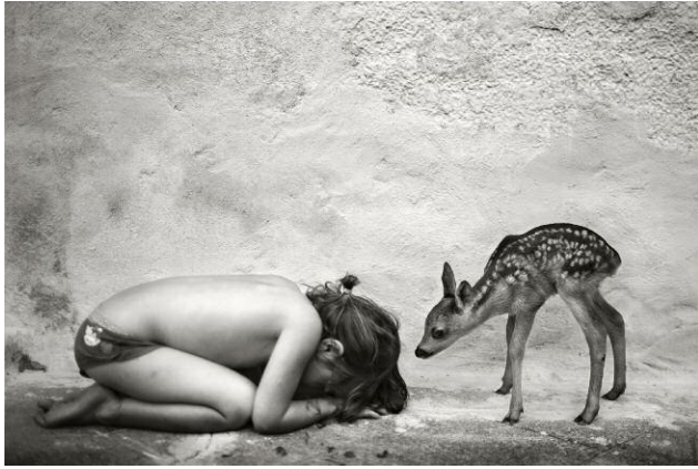
1. © Alain Laboile