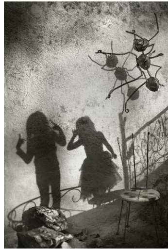
8. © Alain Laboile