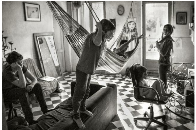
10. © Alain Laboile