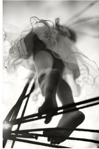
2. © Alain Laboile