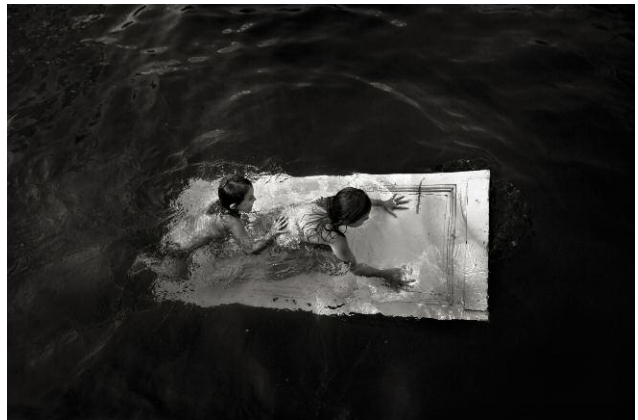
4. © Alain Laboile