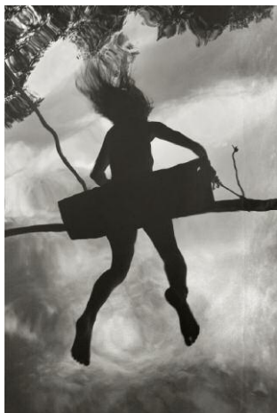
11. © Alain Laboile