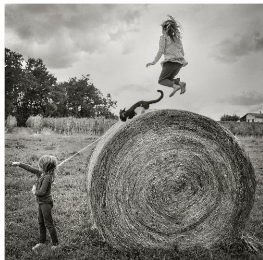
6. © Alain Laboile