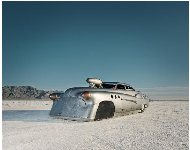
Pressebild 4