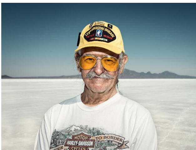
Pressebild 5