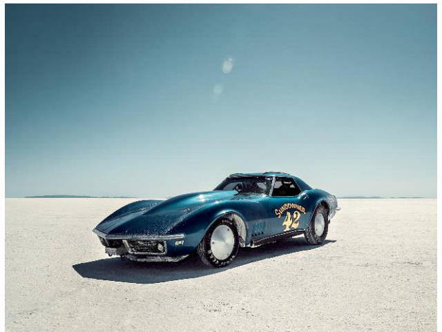
Pressebild 6