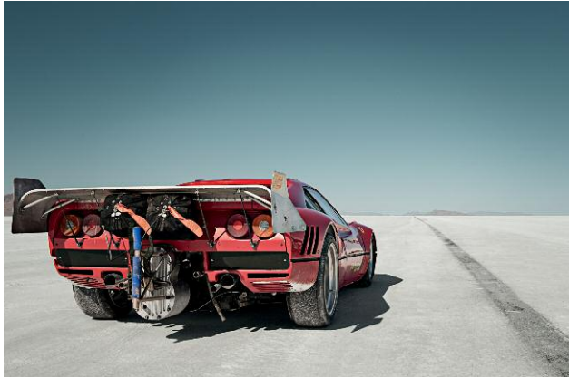
Pressebild 1