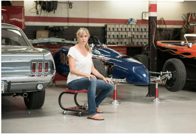
Pressebild 13