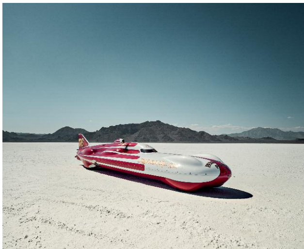
Pressebild 9