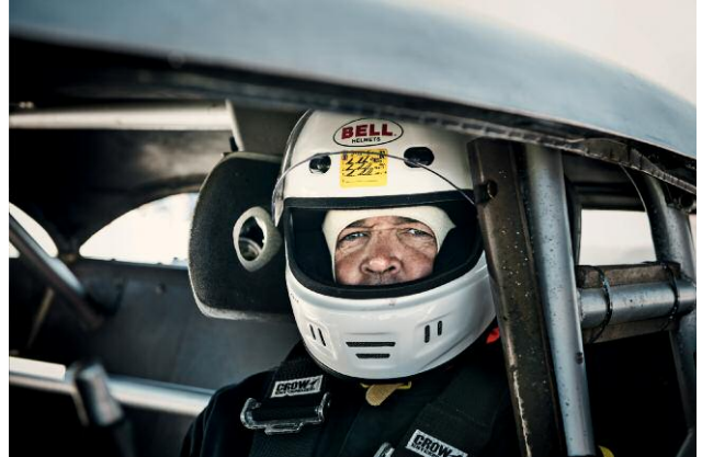
Pressebild 2