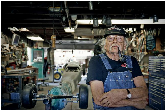
Pressebild 7