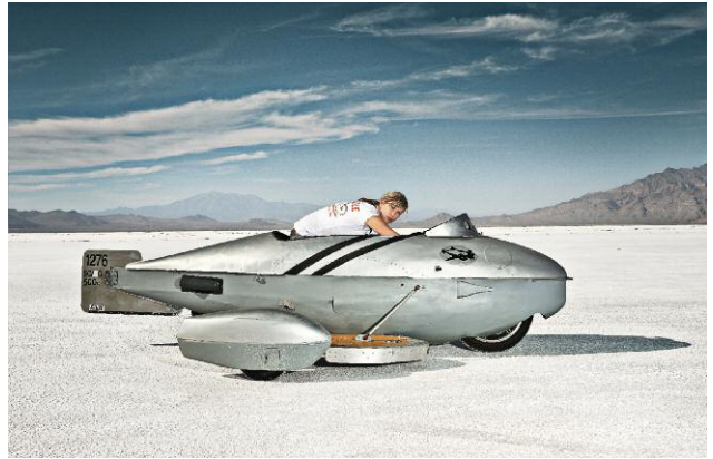
Pressebild 14