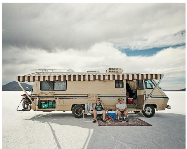
Pressebild 10