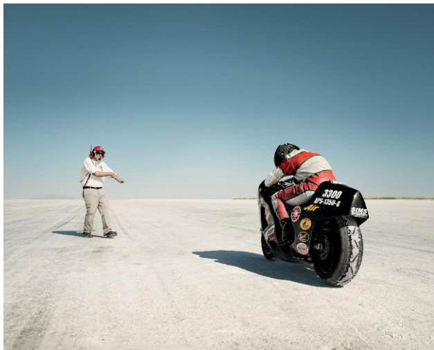
Pressebild 3