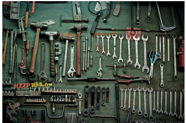
Pressebild 8