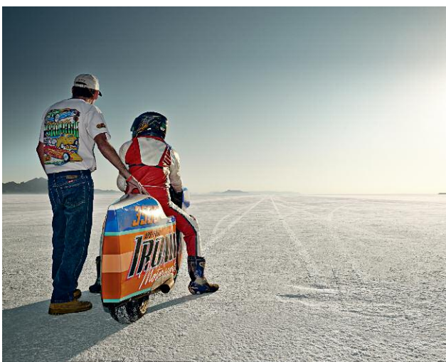
Pressebild 11