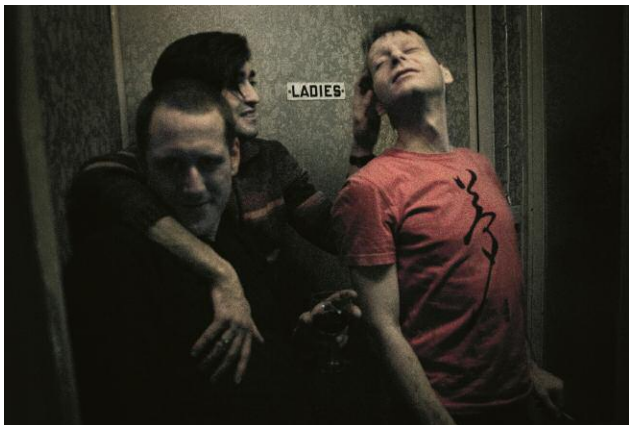
11. © Alisa Resnik 2013