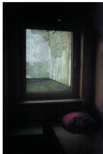
6. © Alisa Resnik 2013