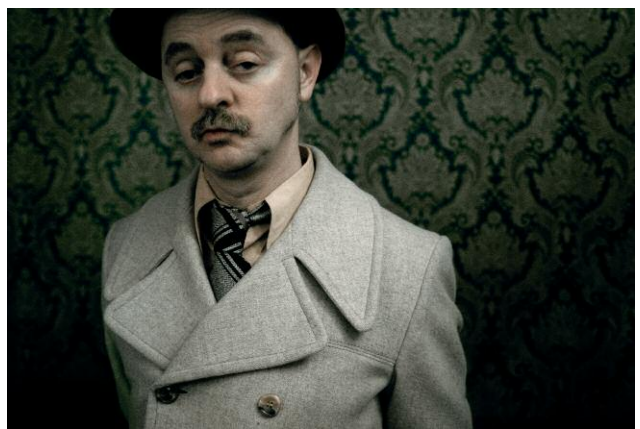
10. © Alisa Resnik 2013