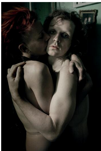
5. © Alisa Resnik 2013