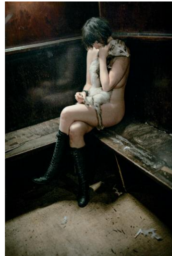
4. © Alisa Resnik 2013