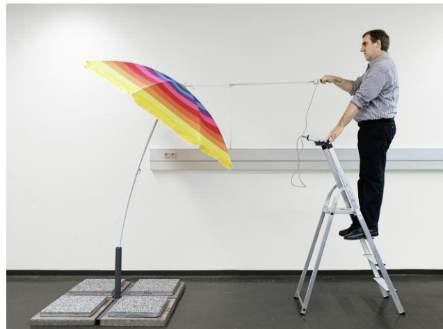
2 PFG 899