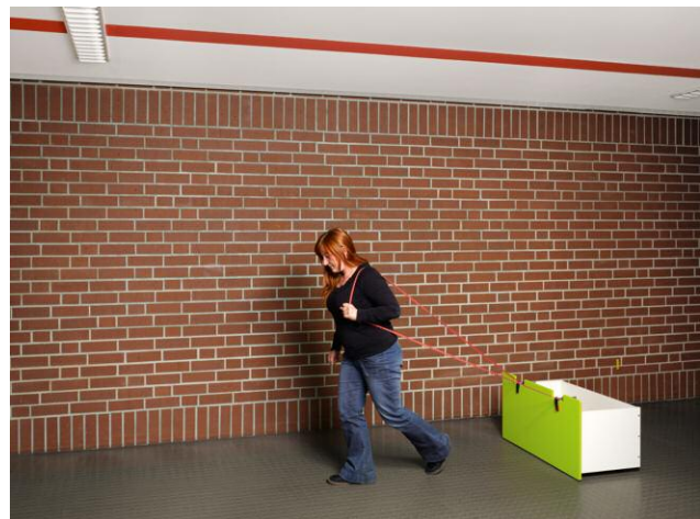
DIN ISO 7170 © Andreas Meichsner