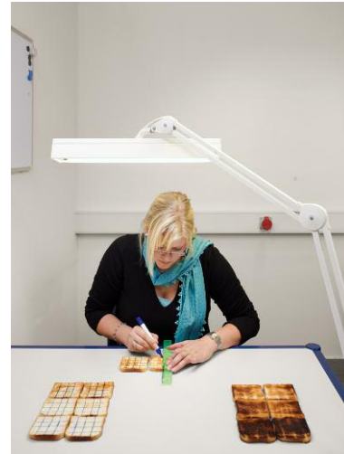
DIN EN 60442