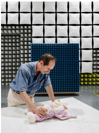
DIN EN 55014-1