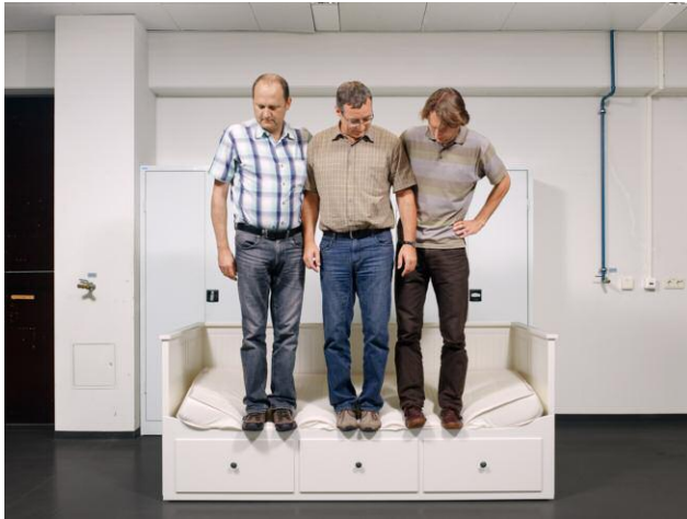
DIN EN 1725