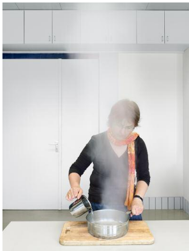
DIN 44904, DIN EN 12983-1