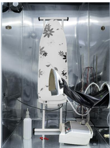
EN ISO 16000-9