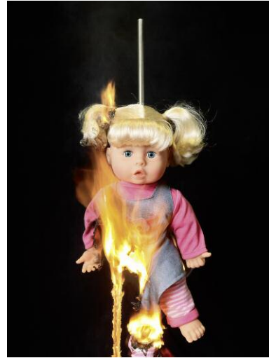
EN 71-2