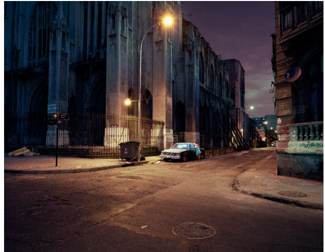
Basilika, 2010