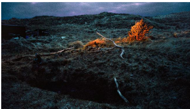
Country Site, 2011 © Anja Jensen