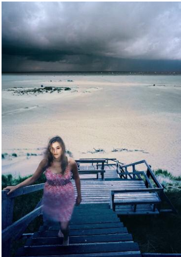
Treppe, 2011 © Anja Jensen