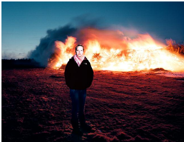
Brandmauer, 2011 © Anja Jensen