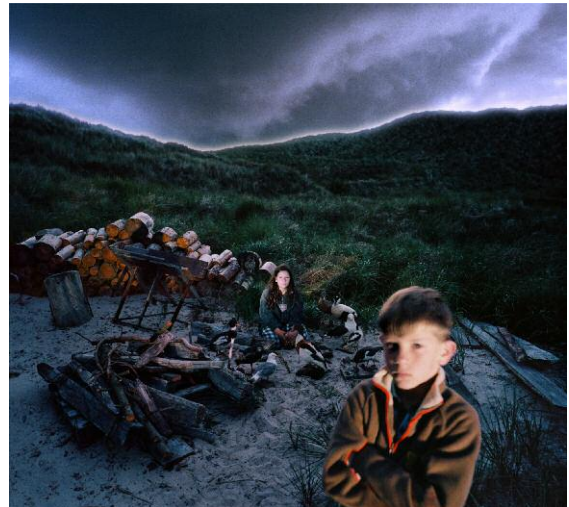
Vogelkinder, 2011 © Anja Jensen