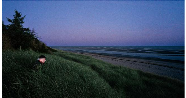
Mann am Meer, 2010 © Anja Jensen