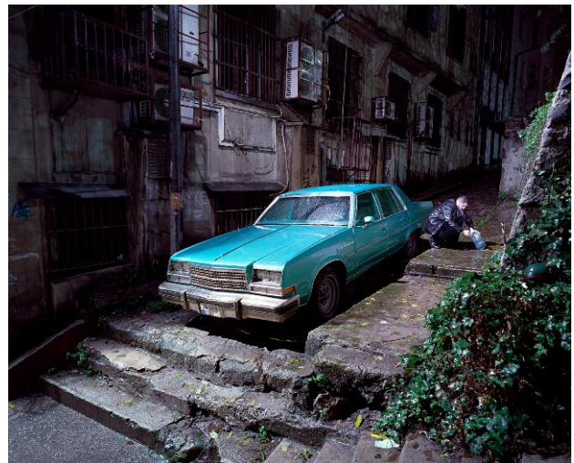
Buick, 2007