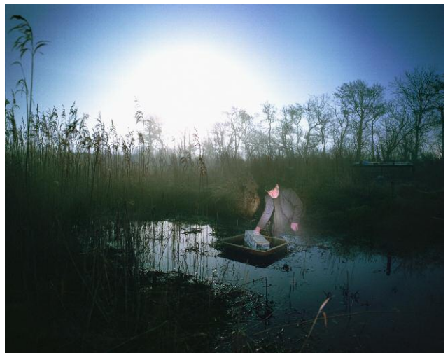
Der Fänger, 2011 © Anja Jensen