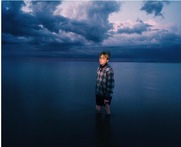
Are, 2011