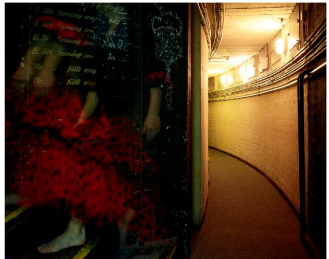
6 Umgang Orchestergraben