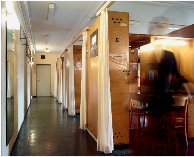
7 Chorgarderobe Herren