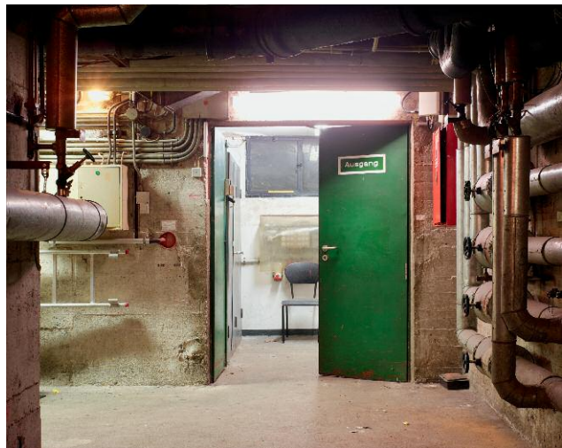
10 Ausgang Haustechnik UG