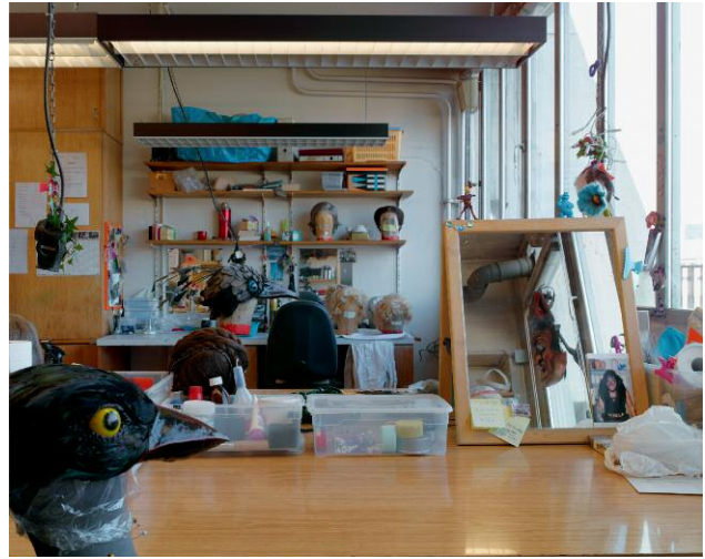
8 Maskenwerkstatt