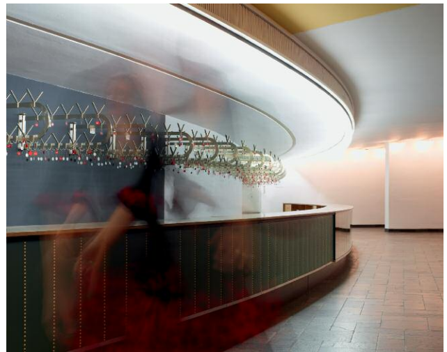
4 Besuchergarderobe