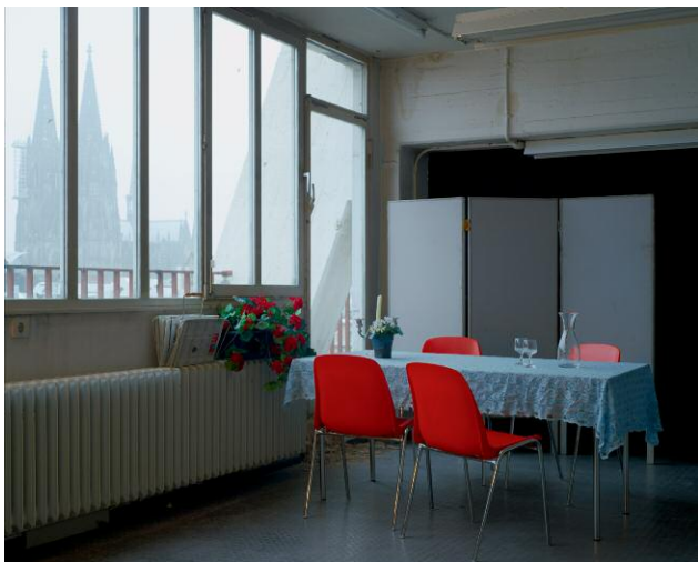
5 Probenraum 6. OG Nord