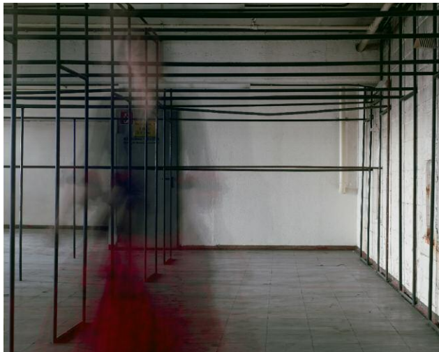
3 Fundus