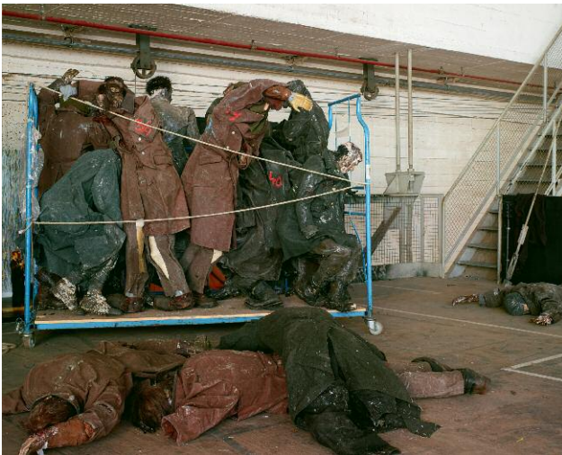
9 Hängeboden Montagehalle