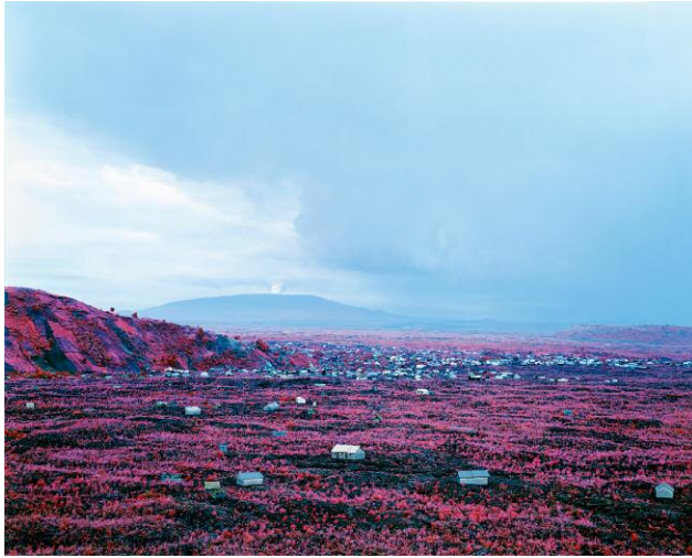
Richard Mosse, City of No Sun, 2012, 183 x 229 cm © Richard Mosse; with courtesy of Art Collection Deutsche Börse