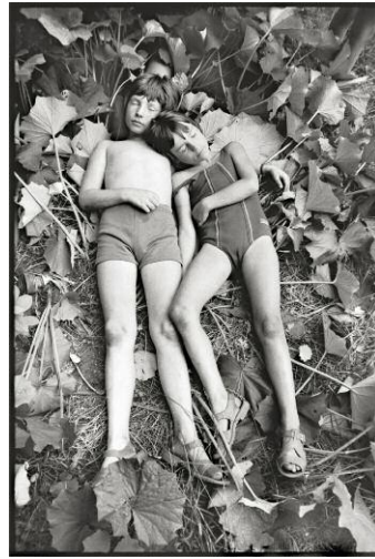
Gerd Danigel, By the roadside of Schönhauser Allee, 1980, 40 x 28 cm © Gerd Danigel; with courtesy of Art Collection Deutsche Börse