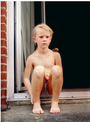
Regine Petersen, Girl with Snail, from the series "To Think About Things," 2006, 66 x 53 cm