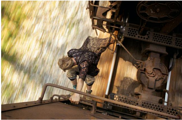
Mike Brodie, #3102, from the series "A Period of Juvenile Prosperity", 2006–2009, 41 x 59 cm ©Mike Brodie; with courtesy of Art Collection Deutsche Börse