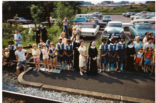
Paul Fusco, from the series "RFK Funeral Train," 1968, 46 x 69 cm