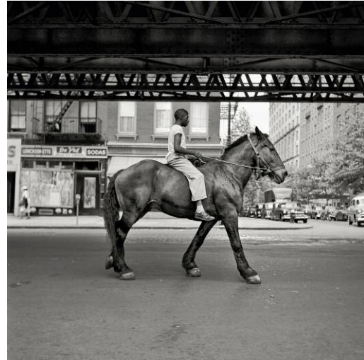
Vivian Maier, New York, NY, August 11, 1954, 31 x 31 cm