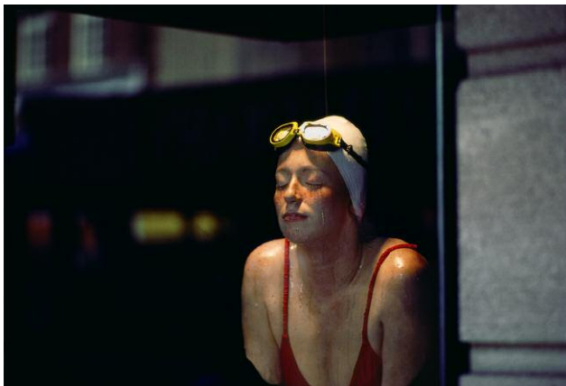
Ernst Haas, New York, 1981, 45 x 65 cm