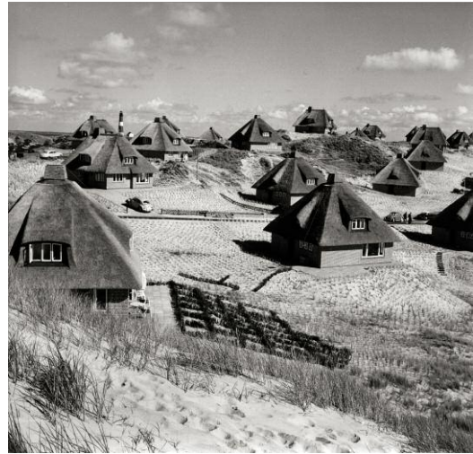
8_Kersig Siedlung, Hörnum 1960