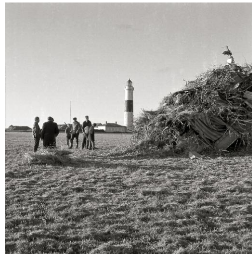
4_Biike, Kampen 1962