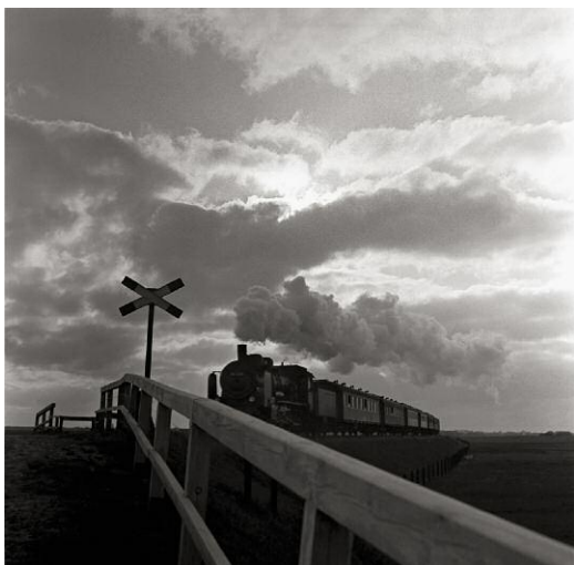
3_Der Zug kommt, Keitum 1931-35