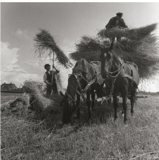
11_Ernte, Tinum 1935