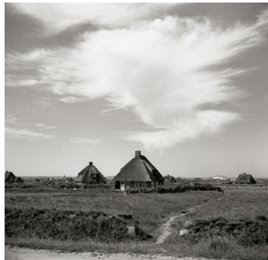
12_Wattweg, Kampen 1951