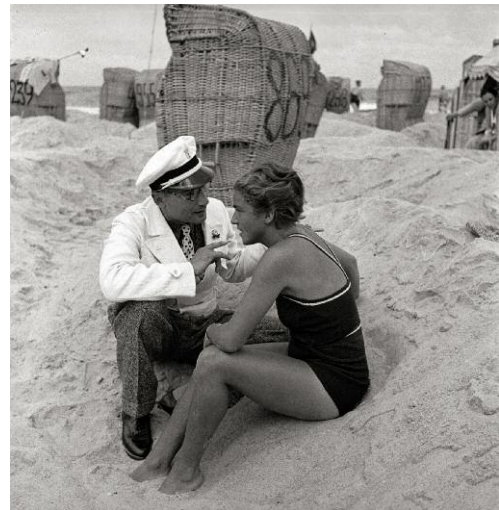
10_Strandgeflüster, Westerland 1935