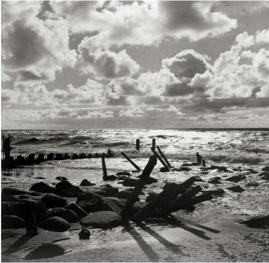
1_Abendlicht II, Sylt 1950