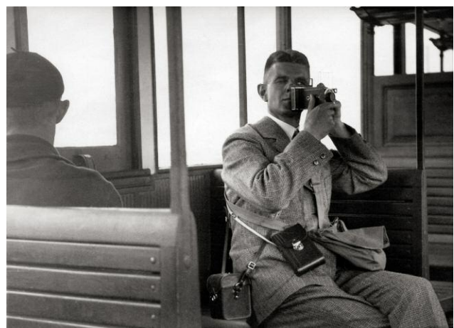
6_Ernster Amateur, Bleicke Bleicken im Zug 1933