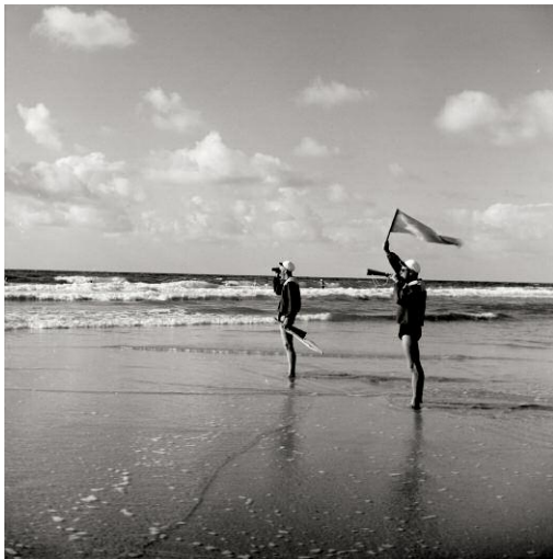
9_Rettungsschwimmer, Kampen 1950