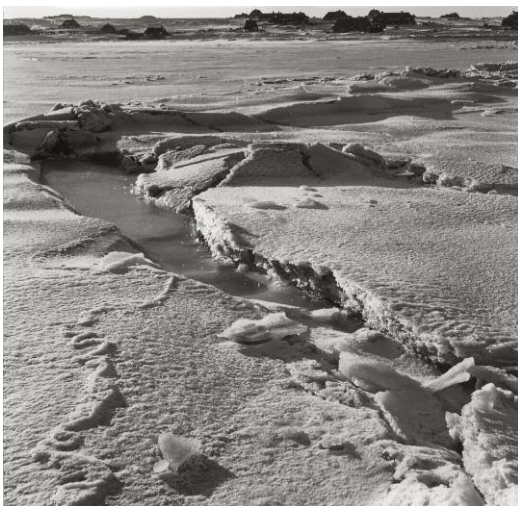
5_Eis auf dem Watt, Kampen 1963