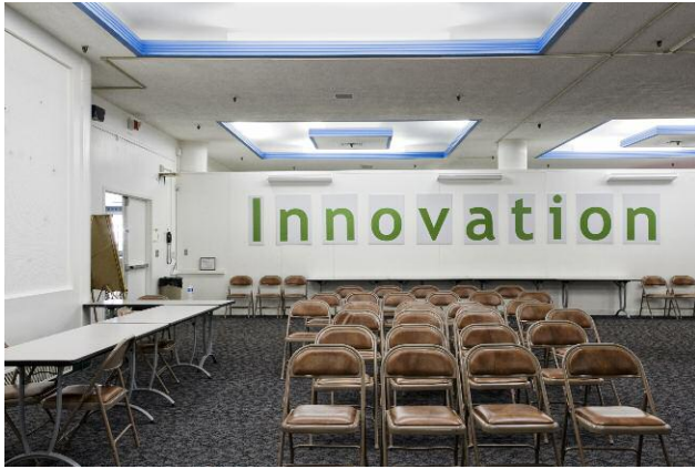
"INNOVATION" conference room, Building 28, Kodak Park, 2012