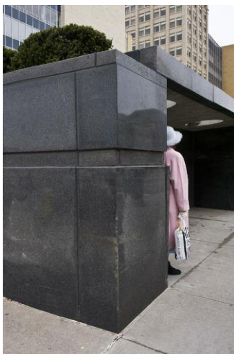
Bus station, State Street, 2012