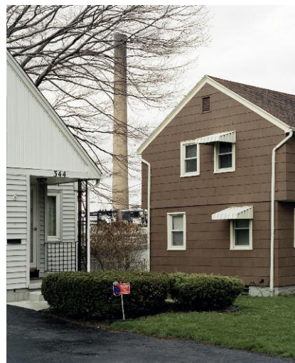
Kodak Chimney, Rand Street, 2007