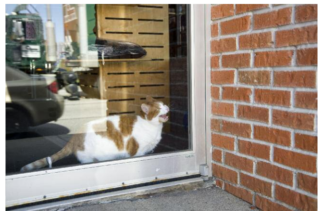
Cat, West Ridge Road, 2012