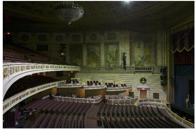
Kodak Hall at Eastman Theatre – Eastman School of Music, 2012