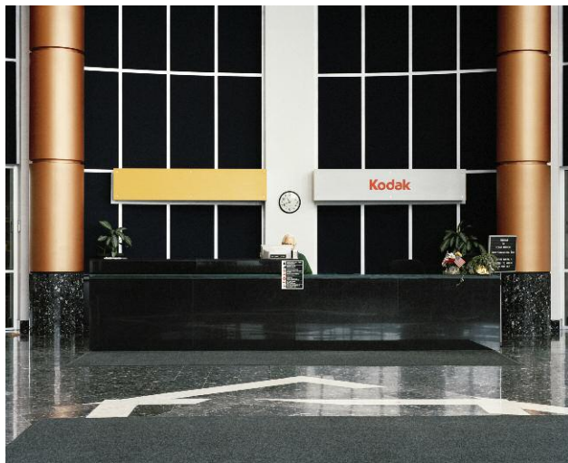
Graphic Communication Group, reception desk, Kodak Park, 2007