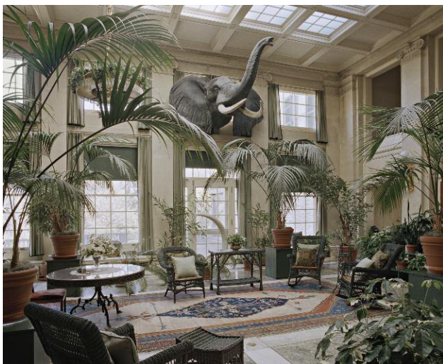
The George Eastman House, Conservatory, 2012