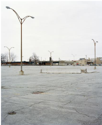
Parking lot, Kodak Park, 2007