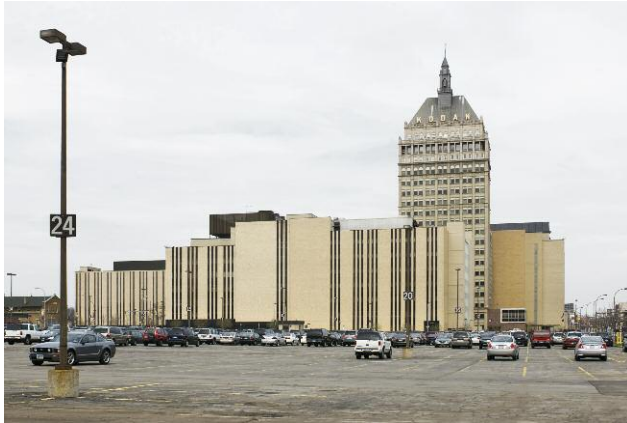
Kodak Tower, State Street, 2007