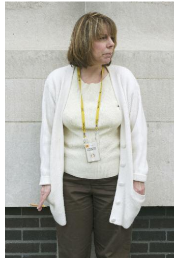
Lease & Field Operations Administrator, Eastman Kodak Company, Kodak World Headquarters, 2007