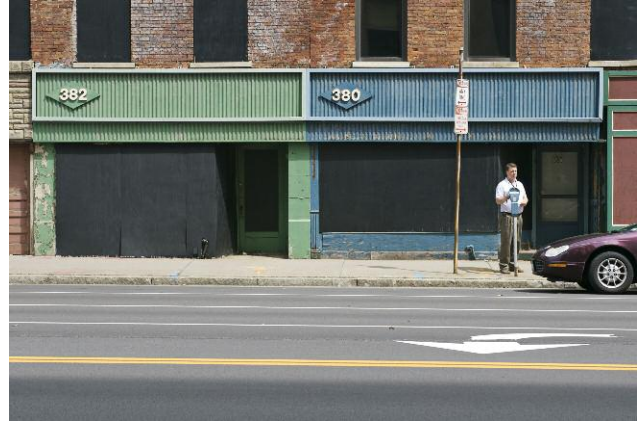
382, 380, State Street, 2007