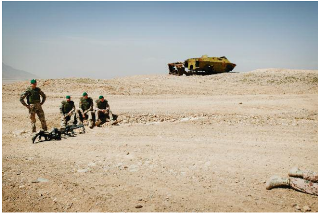
5 German soldiers of Company 4, Mechanized Infantry Battalion 294, based in Stetten—a small town in rural Southwestern Germany— during target practice at a shooting range outside of Kabul. Shot-up Soviet-era armored vehicles litter the joint Afghan National Army- NATO military training facility. 27 March 2007, Kabul, Afghanistan