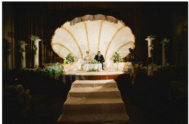
8 A lavish wedding at the Alwiyah Club in Baghdad. The wedding is the creation of May Nuri, a professional wedding planner. Even during the worst of times, with car bombs going off on a daily basis in central Baghdad and horrific sectarian violence gripping the city, huge weddings and festivities still took place. 30 September 2005, Baghdad, Iraq