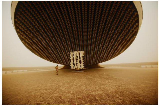
6 The Monument to the Unknown Soldier in Baghdad. The structure was designed by Italian architect Marcello D'Olivo and built between 1979 and 1982. The monument is said to represent a traditional shield being dropped from the dying grasp of an Iraqi warrior. Symbols of the former Baathist regime remain omnipresent in Iraq despite the long presence of foreign forces. 24 April 2009, Baghdad, Iraq