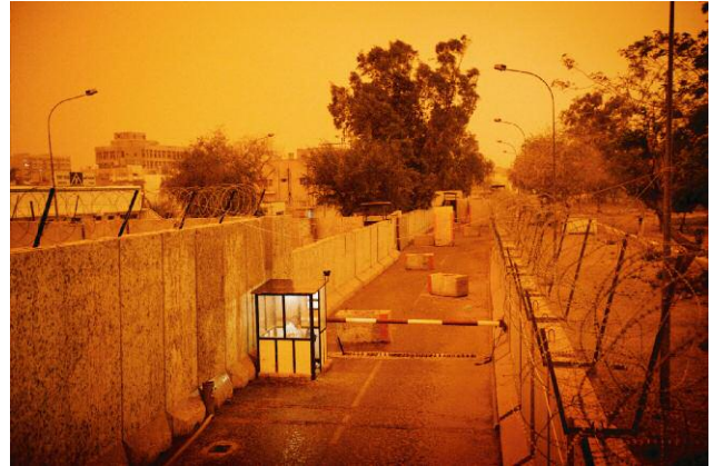
10 The fortified entrance to The New York Times' Baghdad bureau during a dust storm. Iraqi security guards armed with belt-fed machine guns man the gates and watchtowers around the clock. The author lived in this walled compound for a total of about 11 months. 24 April 2006, Baghdad, Iraq