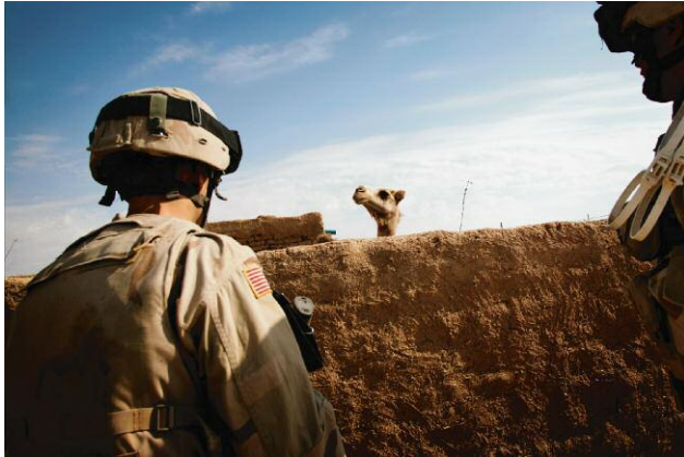
9 A resident camel keeps a close eye on soldiers of the 3rd Armored Cavalry Regiment, Tiger Squadron, Apache Troop during a cordon and search operation in Ba'aj, a predominately Sunni Arab town of 25,000 close to the Syrian border. "Camels!" is an exclamation often shouted by the American soldiers whenever the animals were sighted. 1 June 2005, Ba'aj, Nineveh, Iraq