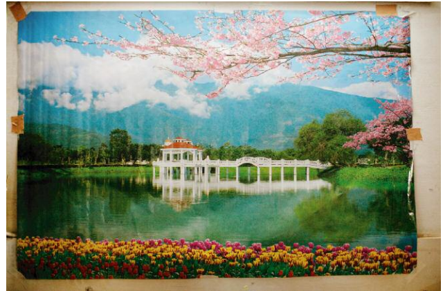
4 Cheap posters depicting scenes of paradise can be found in the most unlikely of places, such as in this rudimentary first aid station run by the 1st Battalion of the Iraqi National Police at a base called Joint Security Station Loyalty in central Baghdad. The unit had just lost 12 men in a single suicide bomb attack. 2 May 2009, Baghdad, Iraq