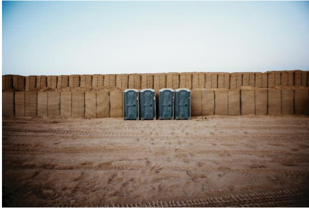
1 Plastic toilets in front of Hesco barriers at Forward Operating Base Howz-e-Madad. Temporary structures dominate the often vast foreign-built military installations, even though such compounds are used for many years. Eventually all installations are either abandoned or handed over to local authorities. 17 July 2010, Zhari District, Kandahar, Afghanistan