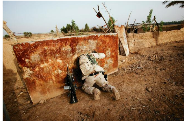
2 An American soldier searches for weapons and bomb-making materials in a disused water tank during a joint operation of the 213th Battalion of the Iraqi Army and American soldiers of the 2nd Battalion, 34th Armor Regiment out of Fort Riley, Kansas. "Sarge! I think I found something!" he shouts from inside the tank. 2 April 2005, Tel Sokhayr, Dyala, Iraq