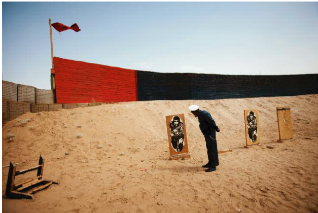
3 An Afghan policeman searches for bullet holes he was supposed to have created on a paper target during a training session conducted by Royal Canadian Mounted Police officers at Camp Nathan Smith in Kandahar. Police training efforts are hampered by corruption, incompetence and illiteracy in the existing Afghan police force. 8 May 2010, Kandahar, Afghanistan