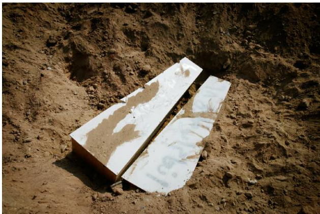
5 © CHRISTOPH BANGERT