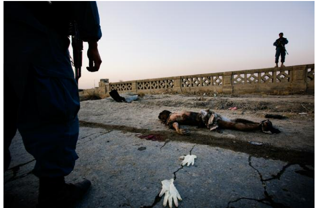
8 © CHRISTOPH BANGERT