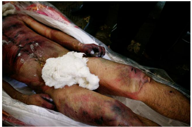
4 © CHRISTOPH BANGERT