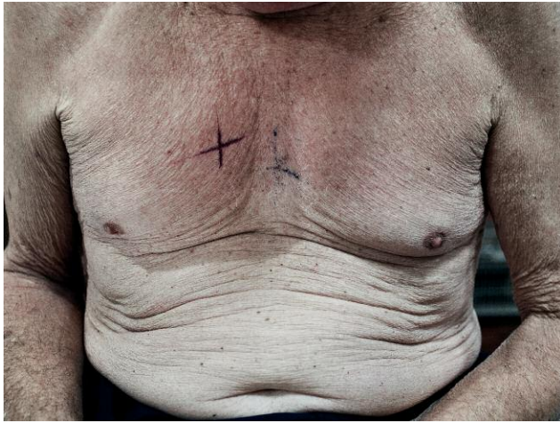
Nr. 7