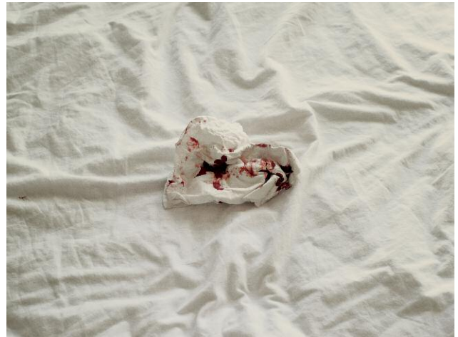
Nr. 10