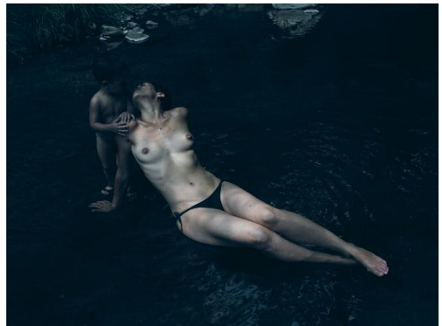
Nr. 6