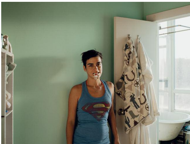
Nr. 5