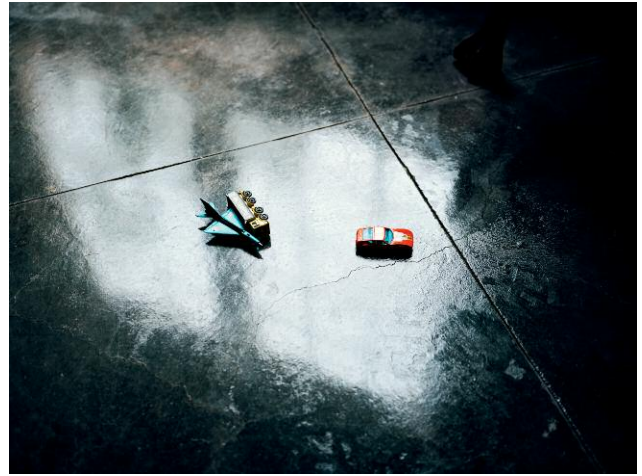
Nr. 8