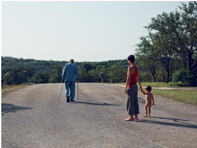
Nr. 9