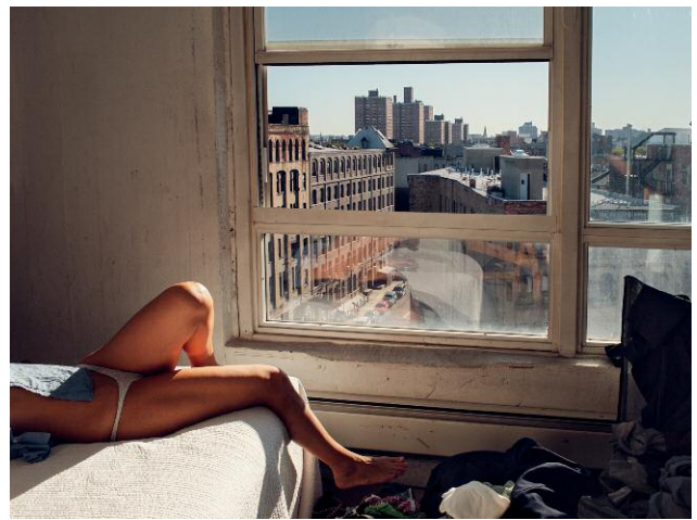
Nr. 2