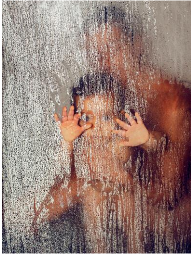
Nr. 1