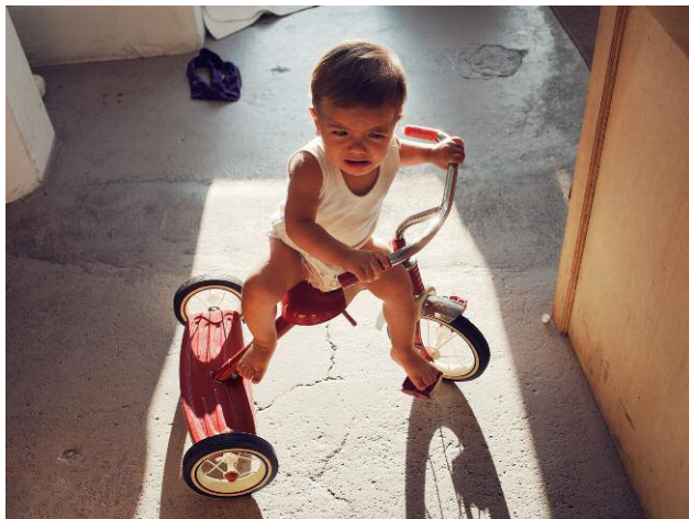
Nr. 3