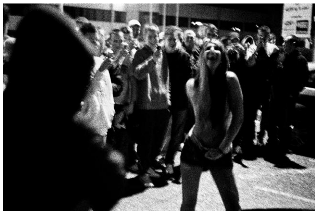
5_ © CJ Clarke