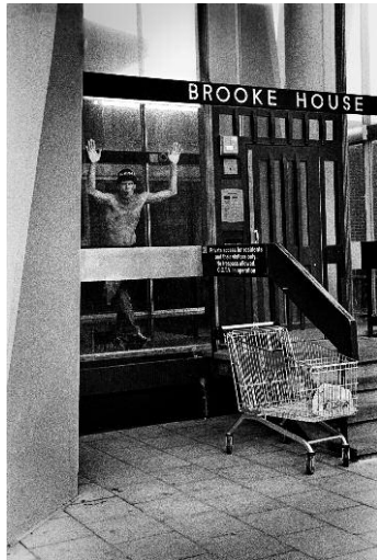
1_ © CJ Clarke