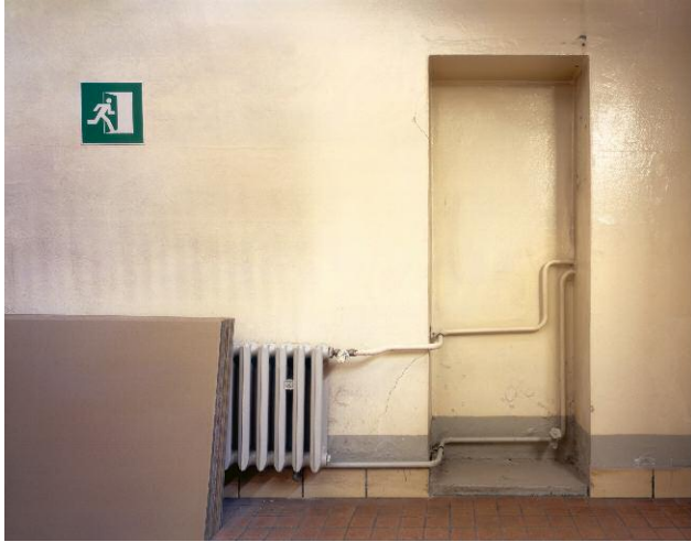
7. Fahrbereitschaft - Ostort: Fluchtweg