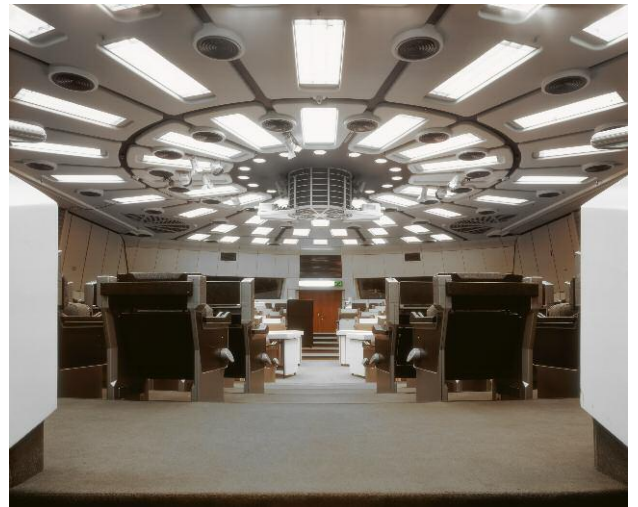
4. ICC - Westort: Saal 6