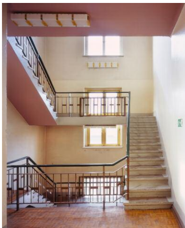
11. Fahrbereitschaft - Ostort: Treppenhaus