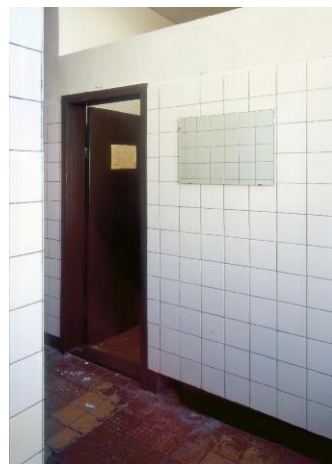
12. Fahrbereitschaft - Ostort: Massageraum