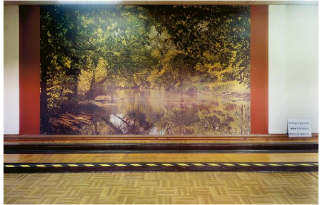
8. Fahrbereitschaft - Ostort: Kegelbahn mit Spreewald