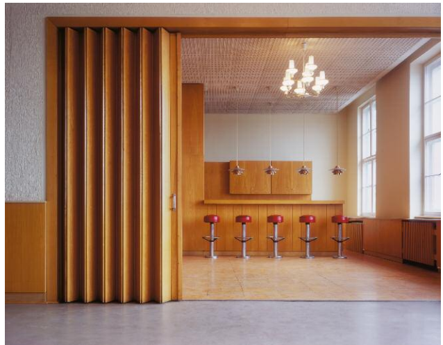
10. Fahrbereitschaft - Ostort: Bar