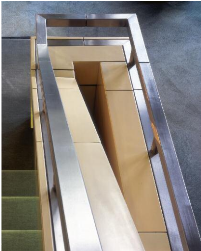
1. ICC - Westort: Handlauf