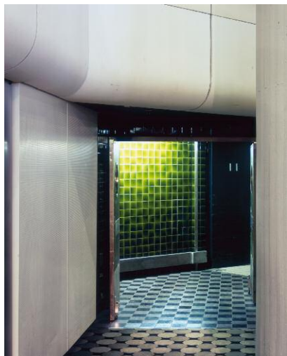
3. ICC - Westort: Eingang Servicebereich