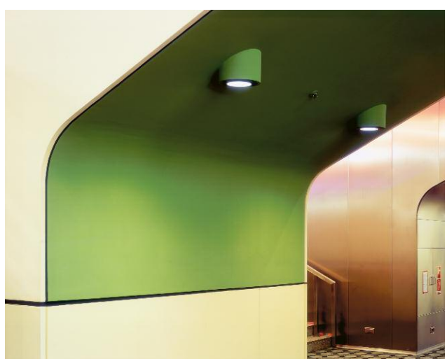
6. ICC - Westort: Gardeebene