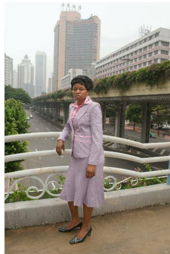
10_WU YONG FU, WOMAN IN LAVENDER, OCTOBER 10, 2010 © WU YONG FU