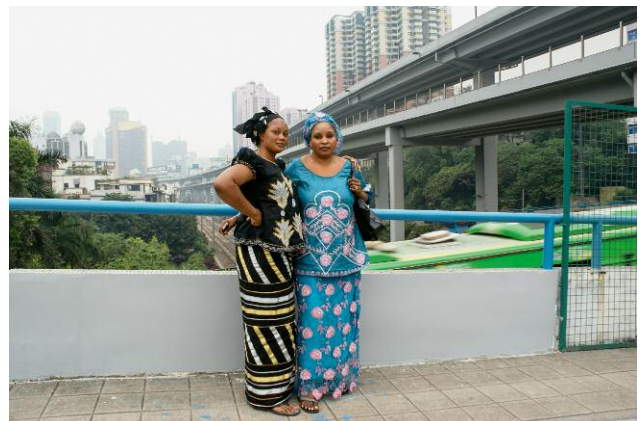
12_WU YONG FU, TWO WOMEN, APRIL 22, 2009