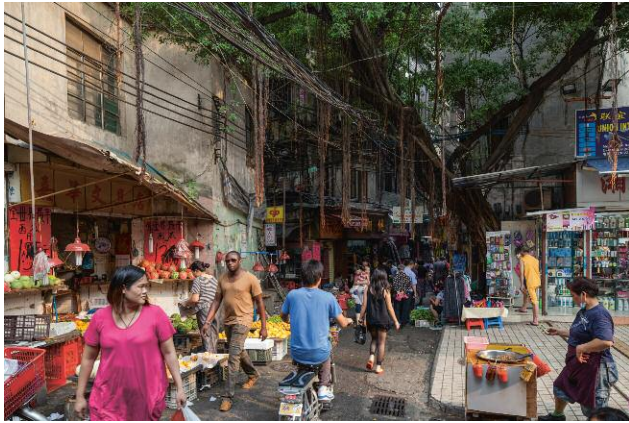
1_ DANIEL TRAUB, Baohan Straight Street, Dengfeng village, May 4, 2012