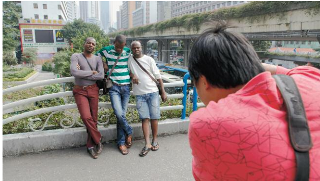
3_ DANIEL TRAUB, Zeng Xian Fang photographing three men, November 23, 2011 (video still)