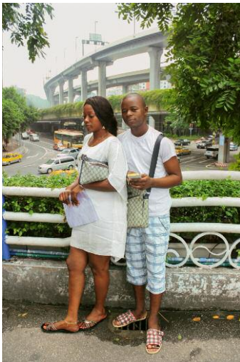
9_ZENG XIAN FANG, COUPLE IN WHITE, AUGUST 23, 2013