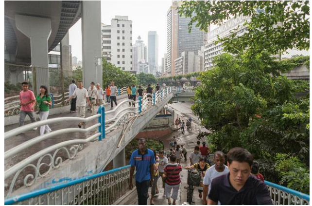
2_ DANIEL TRAUB, The pedestrian bridge, July 30, 2009 © DANIEL TRAUB