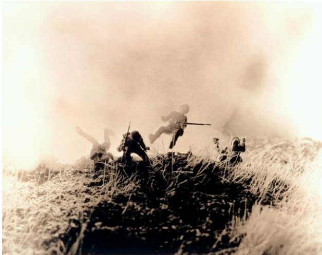
"Untitled from the Series Hitler Moves East" © DAVID LEVINTHAL