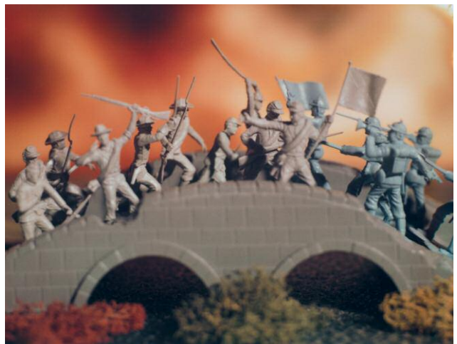
"Untitled from the Series Small Wonder" © DAVID LEVINTHAL