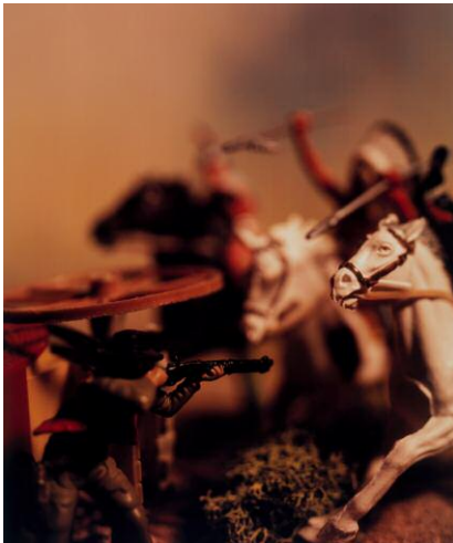
"Untitled from the Series Wild West"