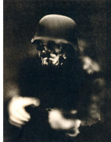
"Untitled from the Series Hitler Moves East"