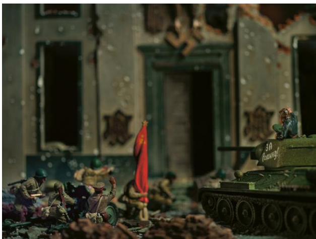
"Fall of Berlin"