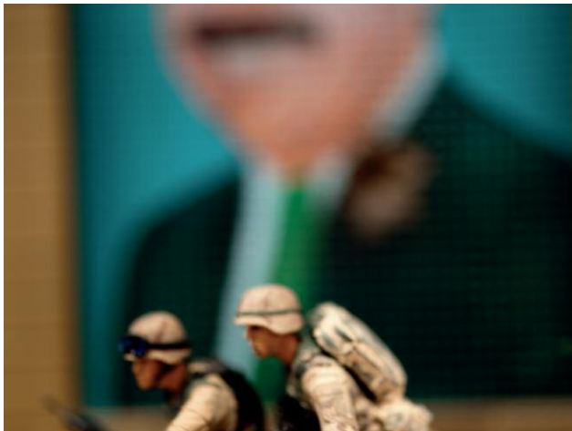
"Untitled from the Series I.E.D." © DAVID LEVINHAL