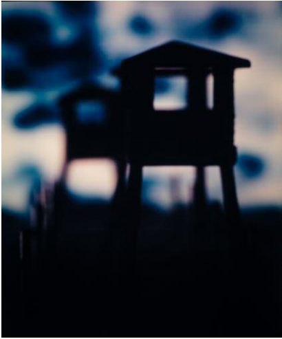
"Untitled from the Series Mein Kampf" © DAVID LEVINHAL