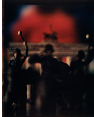
"Untitled from the Series Mein Kampf" © DAVID LEVINHAL