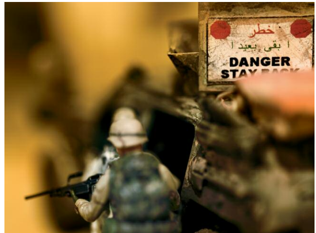
"Untitled from the Series I.E.D."