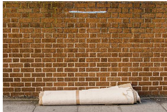
04_Found Not Taken, London, 2008