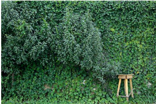
01_Found Not Taken, Luanda, 2013 @ Edson Chagas