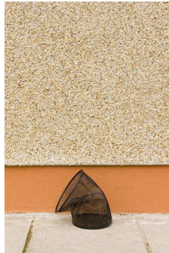
02_Found Not Taken, Newport, 2008 @ Edson Chagas