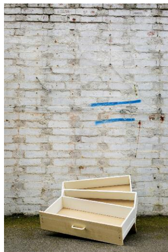
12_Found Not Taken, London, 2014 @ Edson Chagas