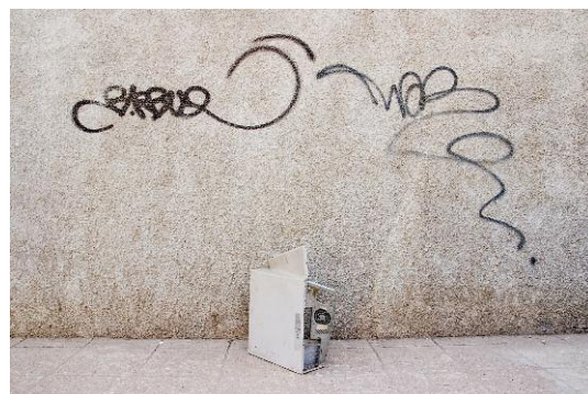
06_Found Not Taken, Luanda, 2009