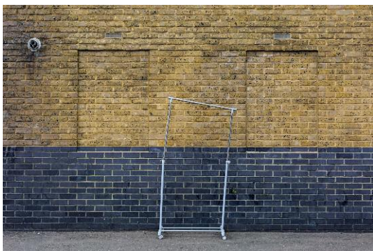
11_Found Not Taken, London, 2014 @ Edson Chagas