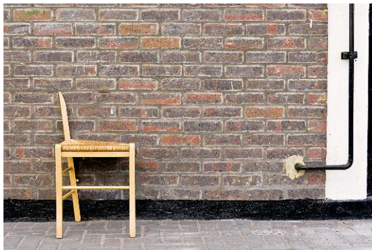
03_Found Not Taken, London, 2008 @ Edson Chagas