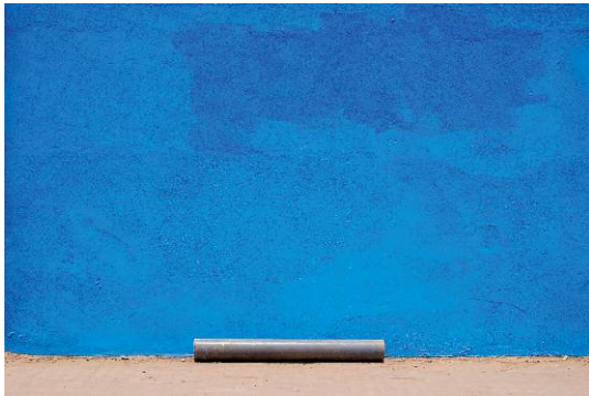
07_Found Not Taken, Luanda, 2009 @ Edson Chagas