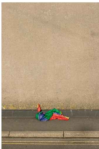
05_Found Not Taken, Newport, 2008 @ Edson Chagas