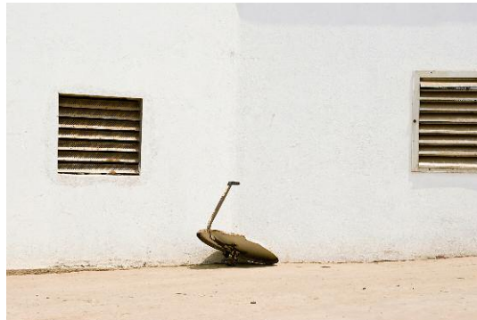
08_Found Not Taken, Luanda, 2009