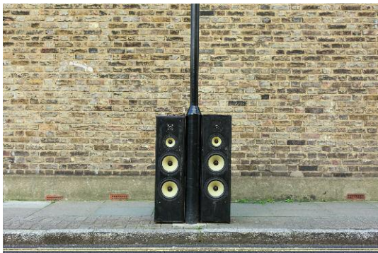
09_Found Not Taken, London, 2014