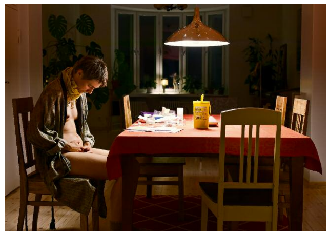
4. Annonciation 10 © Elina Brotherus