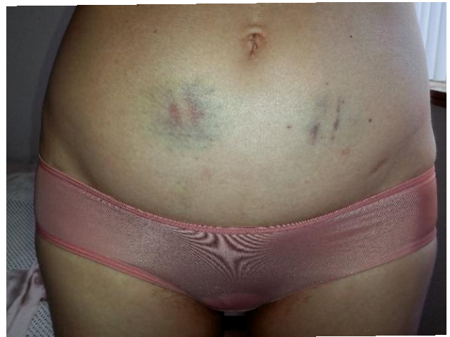
2. Annonciation 29 © Elina Brotherus