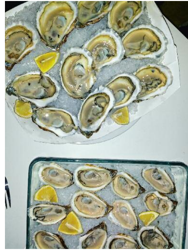
8. Oysters © Elina Brotherus