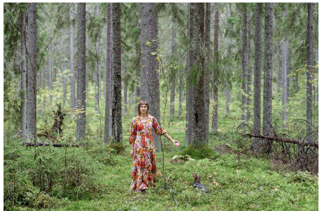
12. Marcello's Theme © Elina Brotherus