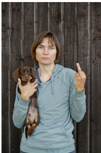
11. My Dog Is Cuter Than Your Ugly Baby © Elina Brotherus