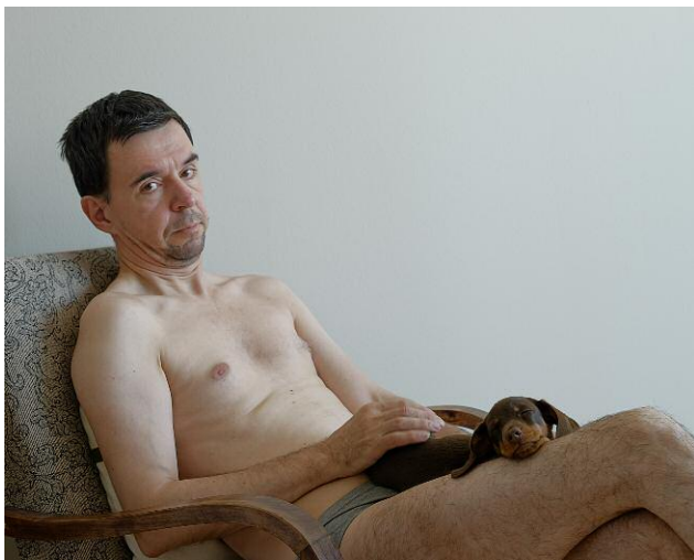
9. Sleeping Puppy © Elina Brotherus