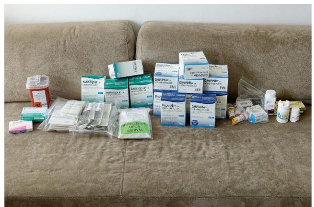
6. Annonciation 25, Medication © Elina Brotherus