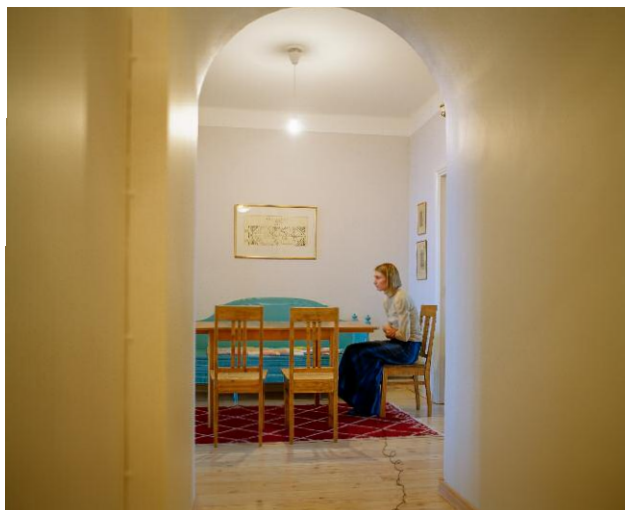
3. Annonciation © Elina Brotherus