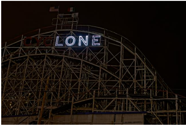
7. Annonciation 29, Lone © Elina Brotherus