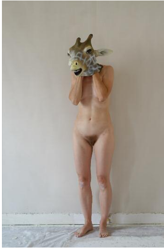
1. Giraffe © Elina Brotherus