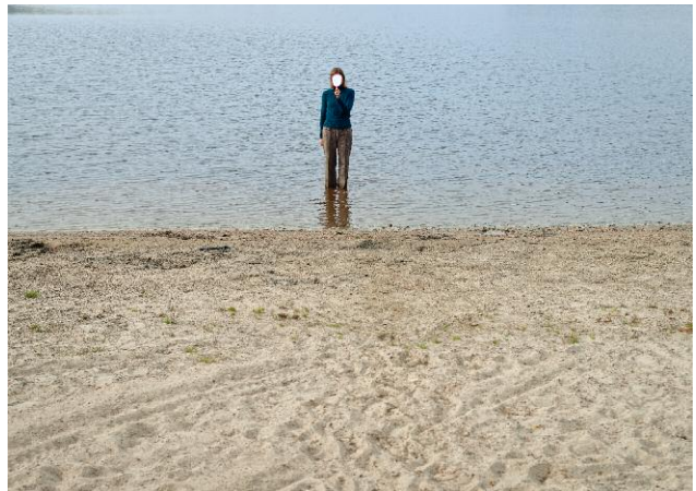
10. Mirror Piece © Elina Brotherus